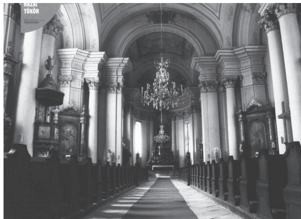
Örmény katolikus templom belseje, Erdély