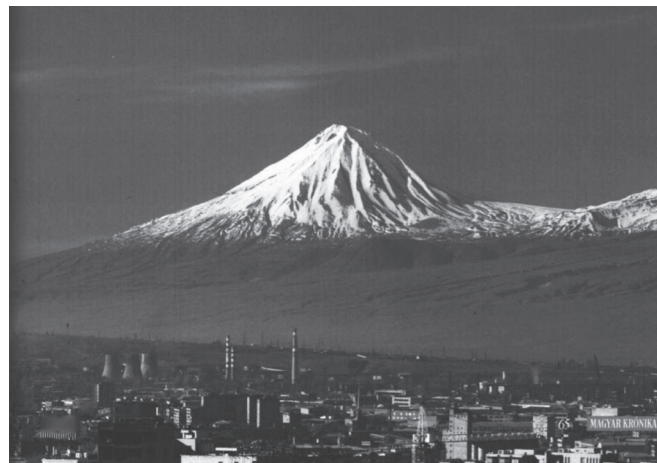
Az Ararat látképe Jereván felől