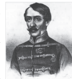
Lázár Vilmos ezredes korabeli portréja

Az 1997-ben alakult egyesület az elmúlt közel negyed században elkötelezetten kutatatta fel és dokumentálta a magyarörmény