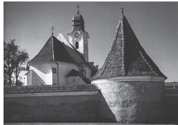
A gyergyószentmiklósi örmény katolikus templom

Az örmények könnyen beilleszkedtek a befogadó magyarságba, bár nyelvüket, szokásaikat jó ideig megőrizték, sőt, Szamosújvár az örmény rítusú római katolikus püspökség székvárosa lett. Kisebbrészt gazdálkodással, leginkább kereskedéssel foglalkoztak. Az élelmeségükre jellemző, hogy sok esetben monopolhelyzetbe kerültek, egy székelyföldi adoma szerint ahol megtelepedtek, onnan a zsidó kereskedők előbb-utóbb továbbálltak. Annyi bizonyos, hogy Gyergyószentmiklós korabeli előjáróinak rendelete értelmében az örmény kereskedők reggel kilenc óra előtt nem pakolhatták ki portékájukat a piacon, hogy így a székelyeknek is legyen esélyük értékesíteni a terményeiket. Ezt nevezi a gyergyói népnyelv örmény hajnalnak. Állítólag idővel a székelyek is a furfangos örmények áruival jelentek meg a piacon, így a rendelet értelmét veszítette.