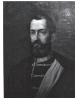
Lázár Vilmos ezredes korabeli portréja