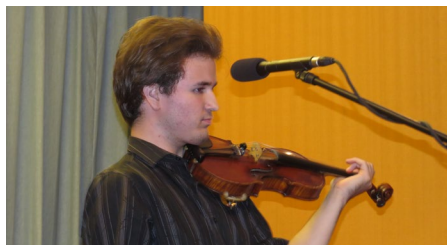
Vörösváry Márton hegedűművész, 2015