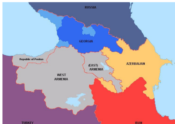
Örmény területek az első világháború végén

megkezdte ülését a – dél-kaukázusi küldöttekből álló – Transzkaukázusi Szejm. Ez a gyűlés március 1-jén indítványozta, hogy a régió, a szejm vezetésével – Szovjet-Oroszországtól függetlenül – kezdjen különbéke tárgyalásokba az Oszmán Birodalommal. Erre a török fél hajlandóságot mutatott, amennyiben az örmény szejm kikiáltja függetlenségét Szovjet-Oroszországtól. Erre április 9-én sor is került és ezzel létrejött a Transzkaukázusi Demokratikus Föderatív Köztársaság, amely három tagköztársaságból, Azerbajdzsánból, Grúziából és Örményországból állt. A szejm képviselői azért is döntöttek a függetlenség kikiáltása mellett, mert azt remélték, hogy a török hadsereg ellenállás nélküli benyomulása a régióba ezzel leál-