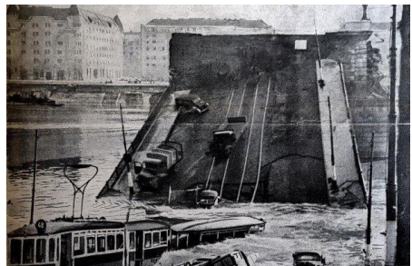
A Margit-híd roncskiemelése