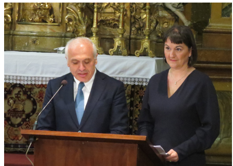
Őexcellenciája Ashot Smbatyan, Örményország nagykövete mondott beszédet a koncert előtt