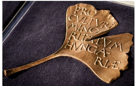
Pro Cultura Minoritatum Hungariae díj