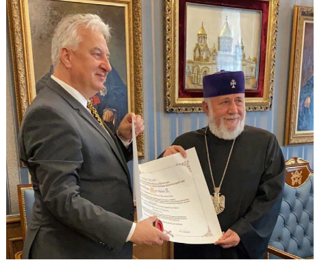
Semjén Zsolt és II. Karekin Katholikosz Őszentsége