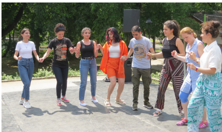
Örmény zenéhez örmény tánc dukált

Megjelent az Örmény Kulturális Központ Facebook oldalán