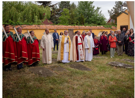
Koszorúzás a templomkertben