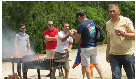
Ebédidőre finom illatokat ontott a sült hús