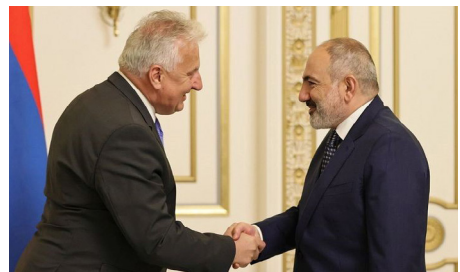
Semjén Zsoltot fogadja Nikol Pasinján örmény miniszterelnök Jerevánban