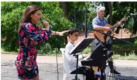
Élvezhettük a NUR zenekar előadását