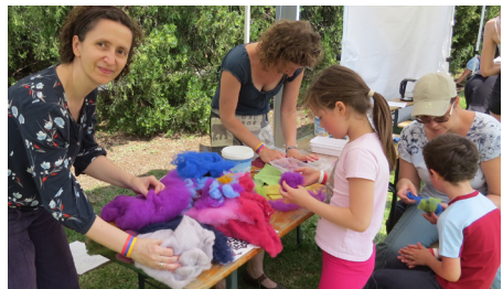
Nemezelní lehetett csodálatos színű gyapjúkból