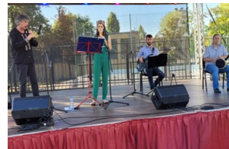
A Group Duduk Együttes koncertje a Nemzetiségi Napon