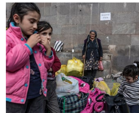
Örmény menekültek