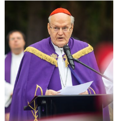
Erdő Péter bíboros, primás a szertartáson.