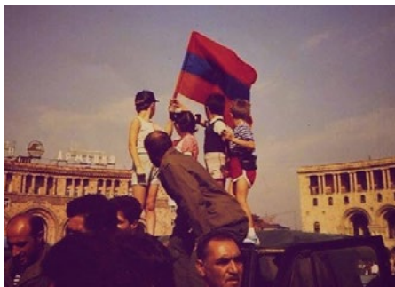
Kikiáltják Örményország kiválását a Szovjetunióból, 1991. szeptember

Hetven év múltán, a Szovjetunió összeomlásakor nyerte vissza ismét függetlenségét Örményország, de a szabad országnak ugyanazokkal a sérelmekkel kellett szembe néznie és megoldást találnia mint az első világháború végén. Mindezek újabb háborúhoz vezettek és egy olyan máig tartó konfliktus idéztek elő a Kaukázusban, melynek megoldása még várat magára.