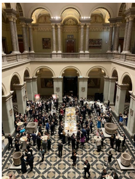
Az esemény méltó helyszíne volt a Szépművészeti Múzeum