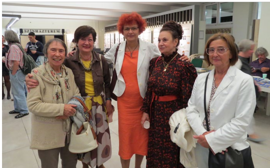
Gyönyörű hölgyek csoportképe a Letelepédsi Napon

Az Erdélyi Örmény Gyökerek Kulturális Egyesület székhelye: 1015 Budapest, Donáti utca 7/a.