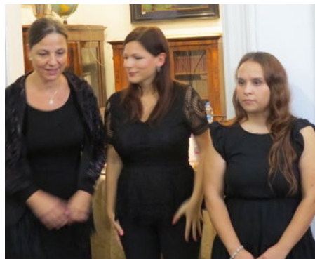
A három fiatal művész