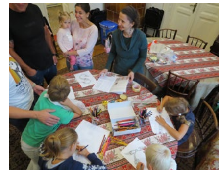
A gyerekek örmény betűket és mécsesstartókat színezték, de a szülők is csatlakozhattak