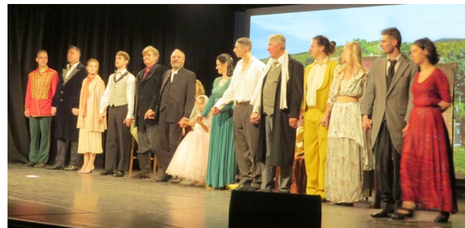
A Csiky Gergely: Cecil házassága előadás színészei

Isten óvja örmény testvéreinket szülőföldjükön.