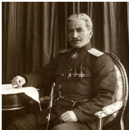
Andranik tábornok

Lori és Akhalkalak provinciák a cári időkben Tiflisz irányítása alatt álltak, de ezeket a török csapatok kivonulása után grúz csapatok szállták meg. Ezért 1918 decemberében örmény egységek elfoglalták és Örményországhoz csatolták Lori tartományt. Azerbajdzsánnal még ennél is bonyolultabb volt a helyzet, mert három örmények lakta régióra terjedt ki követelésük. Nahicseván régió Törökország közvetlen szomszédságában helyezkedett el és 1918 elején, amikor az oszmán csapatok Baku felé tartottak, a tartomány örmény lakossága ellen súlyos atrocitásokat követtek el. Mindez a nemzetiségi arányokat az örmények kárára alakította át, így a terület bekebelezése kérdésessé vált. Zangezúr tartományban a muszlim támadásokat Andranik önkénteseivel verte vissza 1918 augusztusától egészen 1919