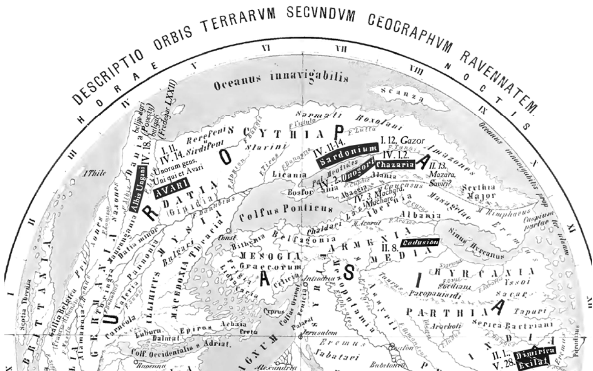
Ravennai Anonymus leírásának térkép-rekonstrukciója (Pinder-Parthey, 1860), a magyar őstörténet szempontjából fontosabb nevek és szöveghelyek kiemelésével (Z.T.Cs.)