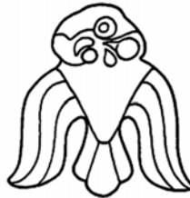
Szkíta aranszas, tegezdísz, Bashadar, Altáj-hegység, 9. kurgán, i.e. 6. század (Marszadolov, 2000)

Ezzel a végére is értünk rövid „felfedező utunknak” az antik források őserdejében, ahonnan a sok azonosíthatatlan név közül, némi „restaurálást” követően kiragyognak ősi népvneveink, szavárdok, magyarok, ogurok, hunok, kadocsák és khorezmiek , akik keleti, kezdetben proto-iráni, majd iráni és némi turáni, ótörök, és belső-ázsiai, mongolos jelleggel, örökséggel gazdagodva, különböző időpontokban járultak hozzá a kárpáti magyarság kialakulásának hosszú és összetett folyamatához.