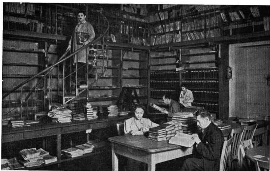
A Hírlaptár kutatóhelyisége 1937-ben