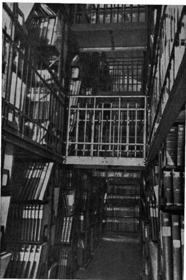
Az első vasterem

összes folyóiratok a Hírlaptár raktáraiba, jelentékeny részük a „müncheni” szakrendszerben, a könyvek közé osztva maradt meg, fokozva a rendbentartás, de főleg a kiszolgálás nehézségeit.