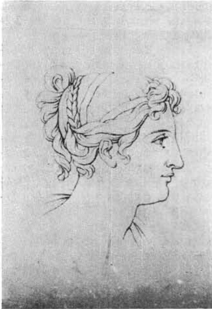
Teleki Blanka rajza 1857-ből

Wohl Janka talán válaszul vagy köszönetül erre a bejegyzésre, 1860-ban megjelent költeményeinek 7 Kertem c. versciklusát ajánlja hálás tisztelete és mély szeretete jeléül Brunswick Teréznek.