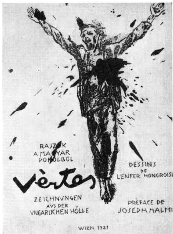
„Kitiltott” könyv címlapja