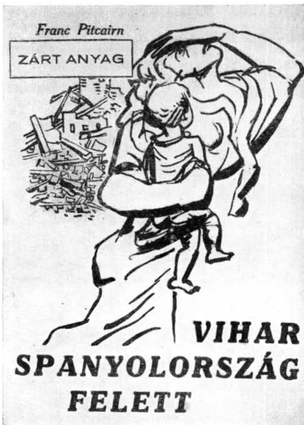
Pitcairn, Franc: Vihar Spanyolország felett. Fordította: Tamás Aladár. A címlapot Pór Bertalan rajzolta.

kellett.” (Egyed István: A mi alkotmányunk . Bp. 1943. Magyar Szemle 175—183. p. Sajtószabadság.) Ezért léptették életbe „az állami rend megóvása végett szükséges sajtórendészeti rendelkezésekről” szóló 1938. évi XVIII. törvénycikket. Az 1938: XV. t.-c. pedig a sajtókamara felállítását rendelte el. Az 1938-as sajtótörvény életbelépése előtt történtek kísérletek a magyar írók egységes tiltakozásának megszervezésére, ezek azonban kudarcot vallottak. A következő évben még egy lépéssel tovább megy a kormány, az 1939: II. t.-c. 151. paragrafusa háború és háborús veszély idejére a sajtóügyekben újra és kibővített mértékben kivételes hatalmat ad a kormánynak. Ez a törvénycikk a sajtószabadság teljes felfüggesztésére is módot adott.