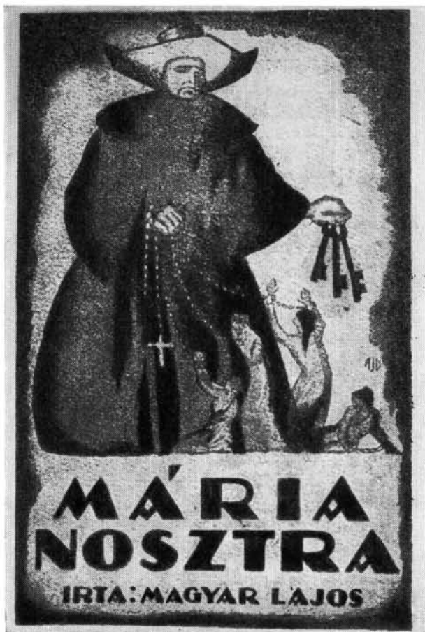
New Yorkban a Proletár Könyvkereskedés kiadásában megjelent riportsorozat a fehér terrorról