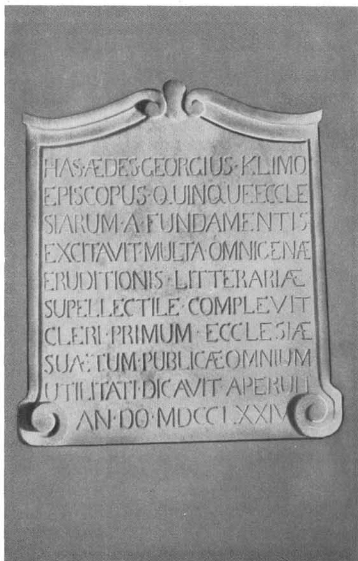
Klimó könyvtárának nyilvánosítási emléktáblája