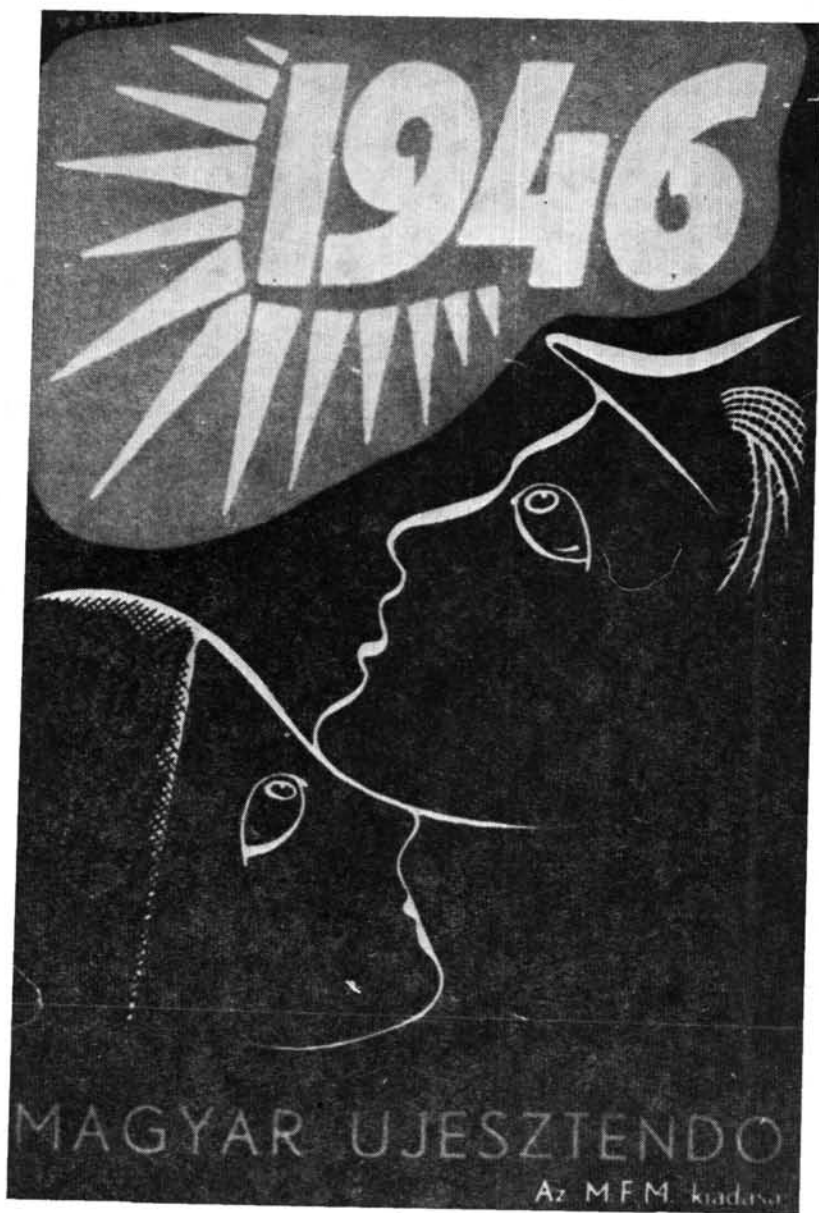
Borítólap. Magyar Újesztendő. Vasarely (Vásárhelyi Viktor) rajza