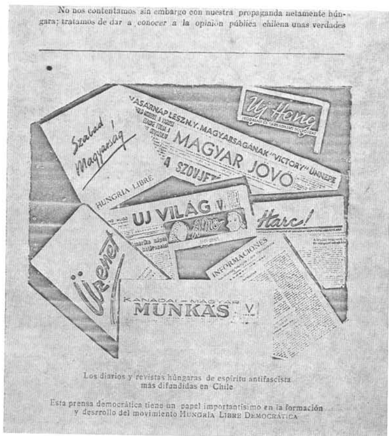
Hungria Libre Democratica. Chile 1943. március 15.

No nos contentamos sin embargo con nuestra propaganda netamente húngara; tratamos de dar a conocer a la opinión pública chilena unas verdades