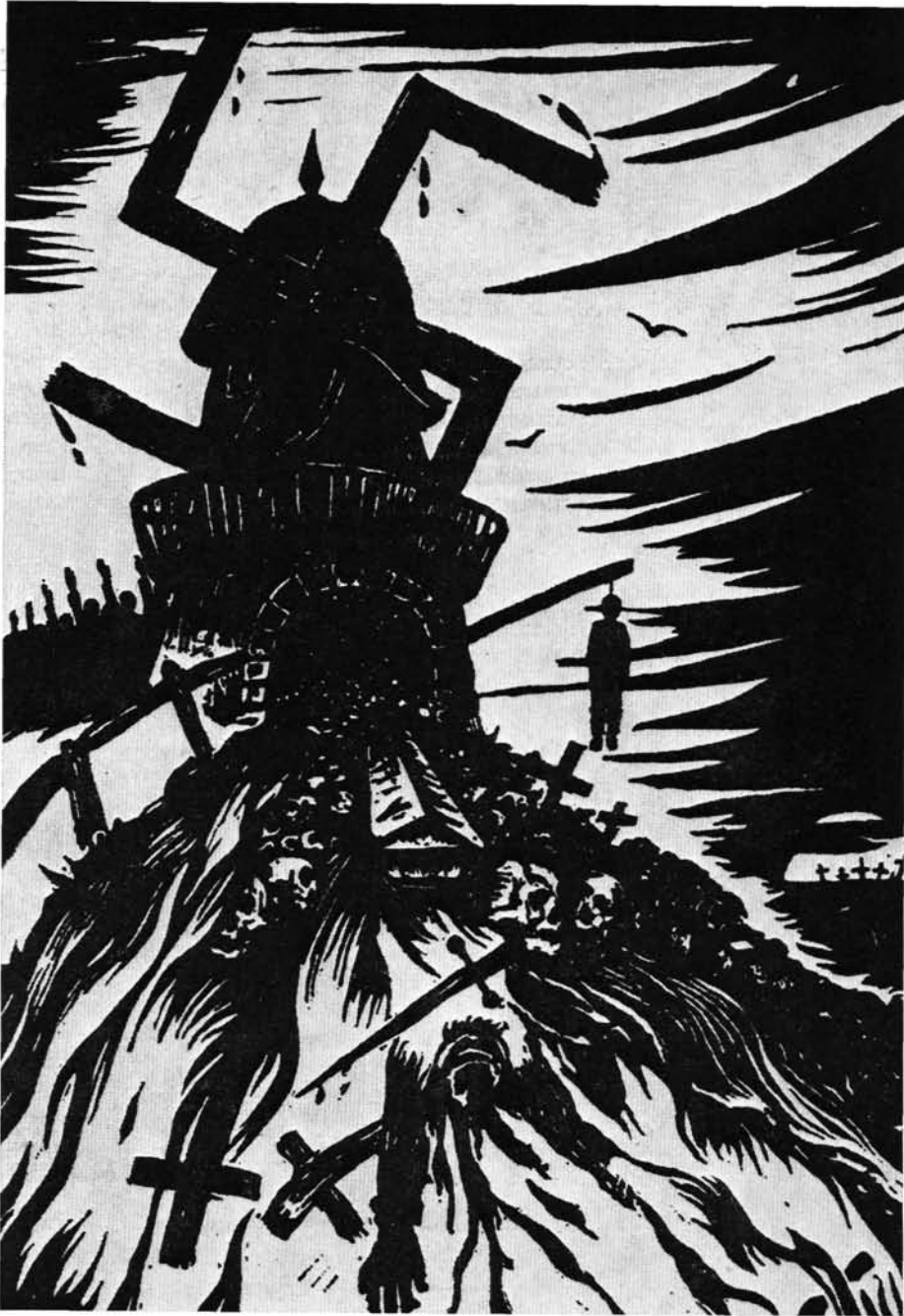
Varsányi Pál: Horogkereszt 1933.