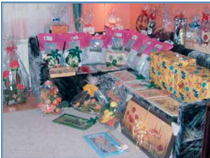
A SZINE tombola felajánlásai a bálra (41 csomag). Szép volt SZINE-ek!!!

Köszönet az édesanyának és a család felnőtt tagjainak emberfeletti vállalásukért, köszönet minden civil szervezetnek, támogatóknak, adományozóknak az adományokért, segítségért, műsorért, az összefogásért. Jó volt újra segíteni! Mindenkire nagyon büszkék vagyunk!