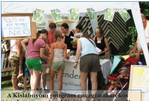
A Kislányom program energiatakarékos (értsd napenergiával fűtött, 40 fokos) standja

Nagy örömünkre a hőség nem vette el a családok gondolkodási kedvét: a közel 600 résztvevő harmada kitöltötte az éghajlatváltozással, energiafelhasználással kapcsolatos kérdőívet! Az eredmények alapján 60 résztvevő kapott ajándékot: a bio élelmiszertől a napelemes elemlámpáig sok apróbb meglepetést osztottunk ki. A három fő díjazott egy-egy vízszűrős kancsót és egy PET-palack zsugorítót vehetett át.