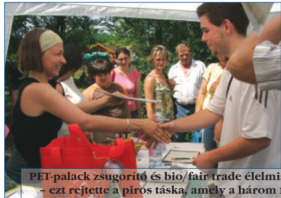
PET-palack zsugorító és bio/fair trade élelmiszerek – ezt rejtette a piros táska, amely a három fődíj egyik nyertesének járt