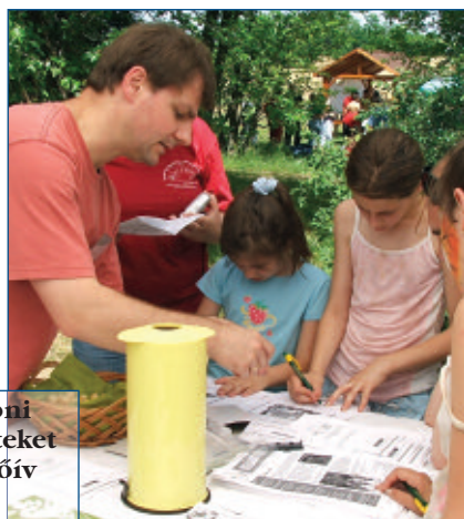
A gyerekek otthoni takarékosági ötleteket gyűjtöttek a kérdőív segítségével