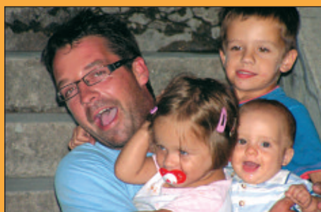
Legszebb pillanat I.