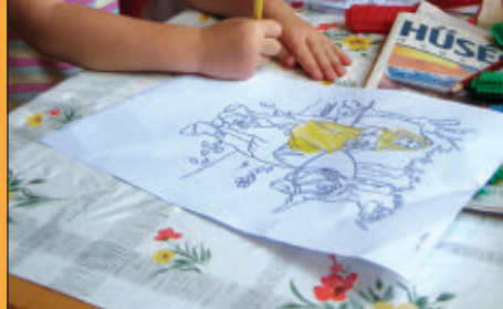
Legszebb pillanat III.