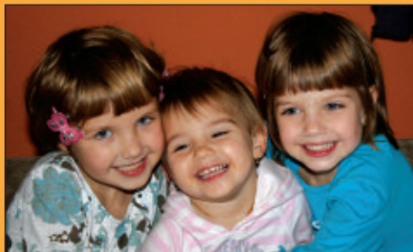
Testvéri szeretet III.