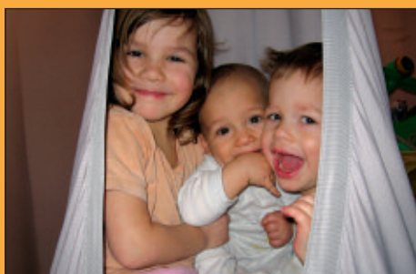
Testvéri szeretet I.