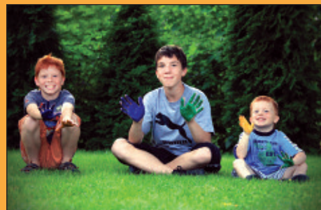
Vidám család III.