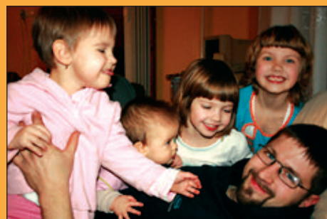
Vidám család I.