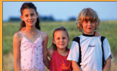
Legszebb pillanat III.