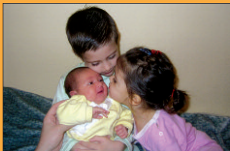
Testvéri szeretet II.