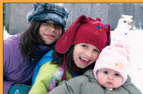
Vidám család II.