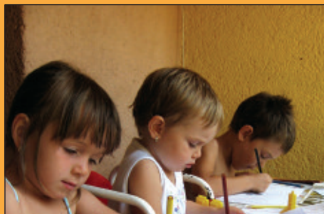
Legszebb pillanat II.