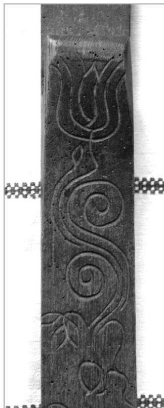
Dédanyám mángorlója (jobbra lent: a mángorló középső része)

Már a XIX. századi források sajátos településként említik, elsősorban egyedi viselete, szokásai és nyelvjárása miatt. Nem véletlenül járt itt Móricz Zsigmond sem 1905-ben! Az bizonyos, hogy volt a temetőben, s felfigyelt az itt látható, szűkebb pátriáján, a Tiszaháton oly jellegzetes csónak alakú fejfákra is. Annak sajnos nincs nyoma, hogy az ember alakú, vagy ahogyan itt mondják a „gombos fejfák” felkeltették volna érdeklődését. Íróember lévén felfigyelt viszont a tréfas sírfeliratokra, egyiket később fel is használta a Pipacsok a tengeren című regényében.