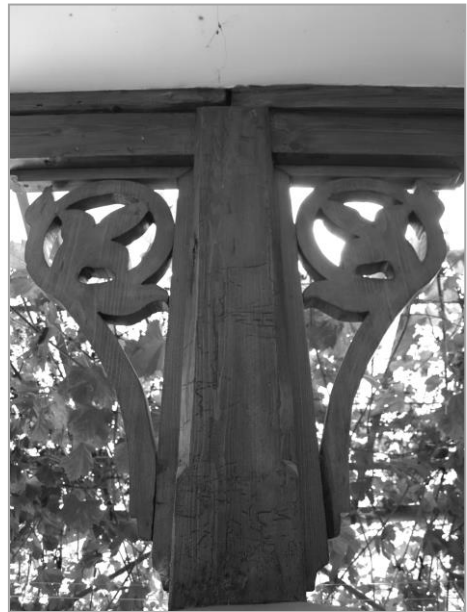
Női fejfa a börvelyi református temetőben (balra); szkíta típusú jel a tornácoszlopon (jobbra)