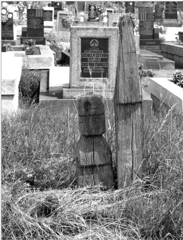
Gombös (női) és csónak alakú (férfi) fejfa a börtvelyi református temetőben

E vélekedés helytállónak tűnik, hiszen Székelyföldről a Rábaközig férfi sírokon valóban sok helyütt láthatunk ilyen fejfákat (nemrégiben, a Szilágyságban járva, Sarmaságon magam is lefényképezhettem pár tucatot). A börtvelyi temető azonban kilóg a sorból, itt ugyanis ember alakú fejfa a női sírokat jelöli – a férfiaké viszont csónak alakú! Ezek a gombos fejfák ráadásul vaskosabbak, törzsökösebbek is, mint a másutt láthatók. Tájéolásuk és házaspárok esetén egymás mellé helyezésük rendje is honfoglaláskorabeli, vagy még annál is régebbi! Hasonlóan Árpád-kori templomainkhoz meg a környék csónakfejfas temetőihez, e sírok mindegyike keletelt, azaz K-NY-i tájolású, s minden fejfa nyugatra néz.