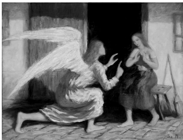
Szúdy Nándor festményei: Angyali üdvözlet (1952 k. – Oltalom Alapítvány, letét); szemközt: Káin útja 4. (1954 – Sárospatak, Református Gyűjtemény)

mazni, mégis beismerte, hogy Szúdy – bár nem igét hirdet a festményen, de – „olyan mondanivalókat fest vásznára, amelyekről minden mai igehirdetésben sok szónak kellene esni. Az emberiség nagy kérdésével, a béke ügyével foglalkoztak ezek a képei. Olyan dolgok álltak szemünk előtt, amelyekről emberi szóval már képtelenek vagyunk gondolatainkat közölni.” Hozzátette, hogy a bibliai történet a képen olyan, mint a „vízbe dobott kő, amely fölzarvar és a csendes vizen hullámgyűrűt hullámgyűrűre hajt. A bibliai üzenet így érkezik, meg nála a modern humánus, sőt a kozmosz partjaiig.”