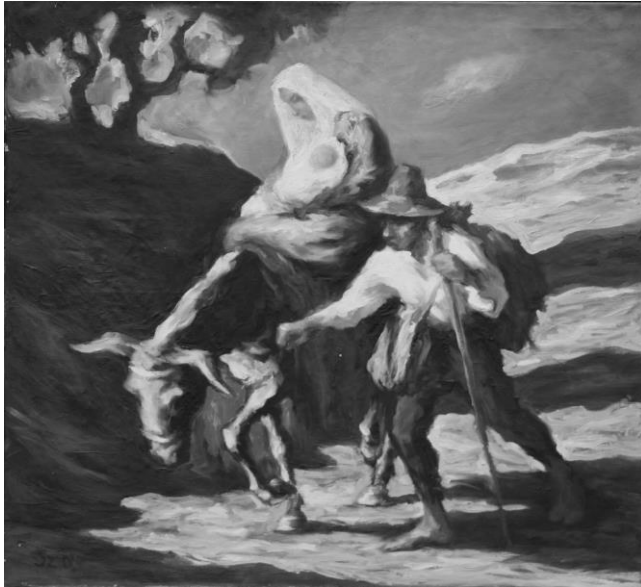
Szúdy Nándor: A család visszatér (1957 – Oltalom Alapítóvány, letét)