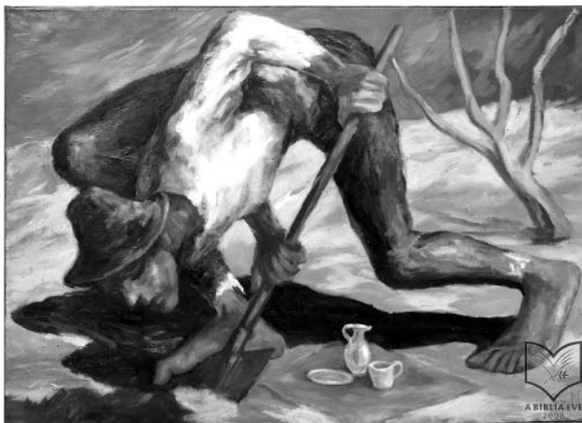
Szúdy Nándor: Az elrejtett kincs (1965 k. – Forrás: Lőrincz 2008)