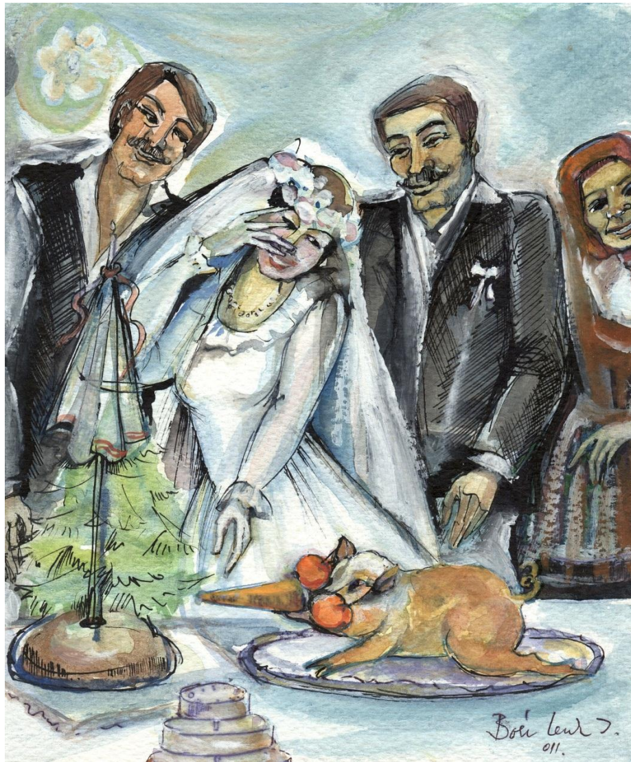
4. Purceluș fript cu capul erotico-obscen (Ilustrație: Boér Lenk Ilona)