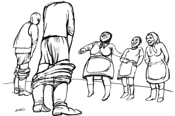
2. Trecerea în revistă a izmenelor