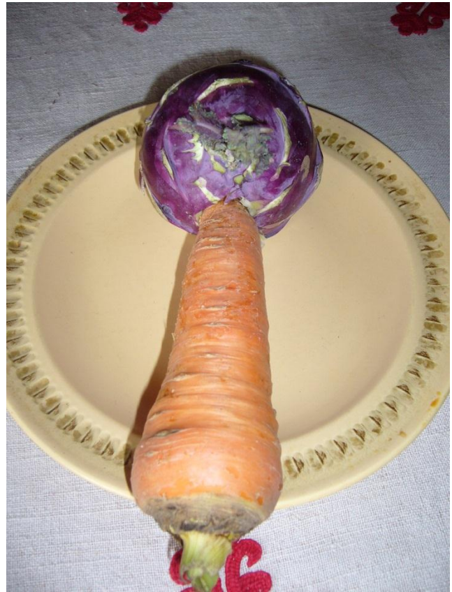
5-6. Bucate erotice puse pe masa mirilor

Mai demult, la capătul primei mese s-a servit ca ultimul fel de mâncare (înlocuit ulterior cu cafea) prune uscate fierte, moment care a declanșat o caustică și intrigantă scenă de batjocorare a bărbaților. Nu insist asupra ritului, voi încerca doar să traduc niște versuri dintre cele aproape intraductibile. Aducerea castroanelor este întâmpinată de cântecul bărbaților: „Pruna mea dulce, ce bună ești, / Tot te mănânc, iar tu tot mai ești!” La care replica ofensivă, cântată a femeilor înăbușe cântecul bărbaților: „O, părul lui Dumnezeu 16 , gârbovit, îmbătrânit, / Cu două fructe pe el atârdate, / Și acele-s veștejite.”