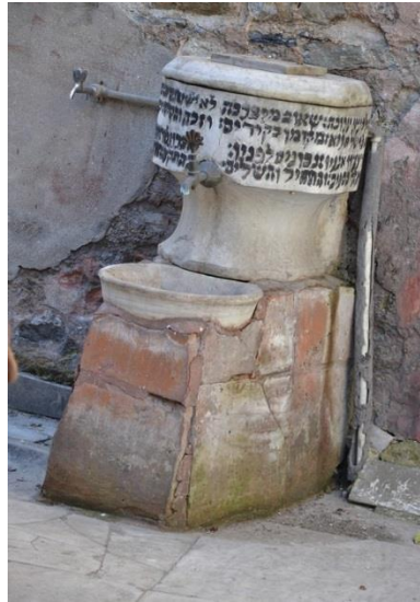
Vasque de marbre et inscriptions en hébreu

La synagogue est une grande et haute maison en bois.