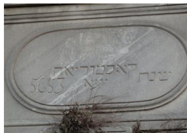
Nom de la synagogue et date en hébreu