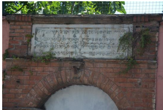
Synagogue Maalem Hasköy (séfarade)

Après la visite de la synagogue caraïte, nous nous promenons dans le quartier.