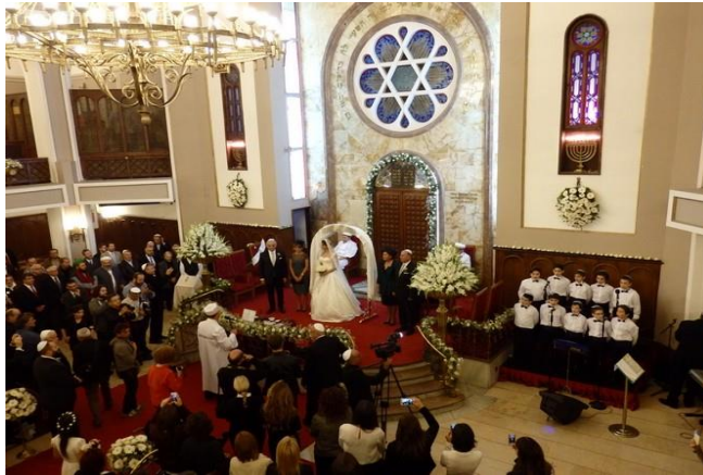
Synagogue Neve Shalom Mariage

Après les années 40 et le terrible impôt sur la fortune 15 qui frappa les minorités du pays, beaucoup de Juifs quittèrent la Turquie pour le nouvel Etat d'Israël, l'Amérique du Sud, l'Amérique Centrale ou encore la France. C'est aussi l'époque où certains changèrent à nouveau de quartier migrant vers Şişli ou Kadiköy.