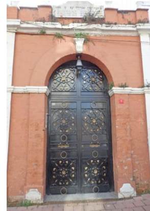
Synagogue Ahrida toujours en service