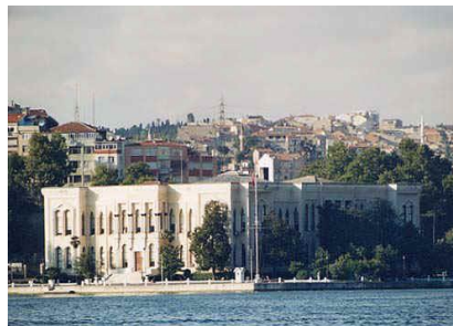
Palais Camondo sur la Corne d'Or aujourd'hui Marine Nationale