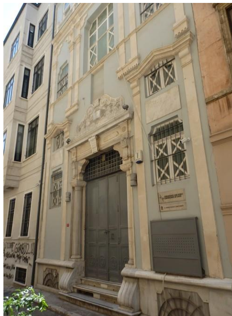
L'ancienne synagogue Schneider

et le centre culturel juif (installé dans l'ancienne synagogue Schneider depuis 1998) sont à proximité.