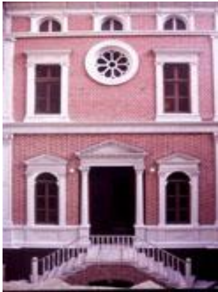
Synagogue-musée Zulfaris façade