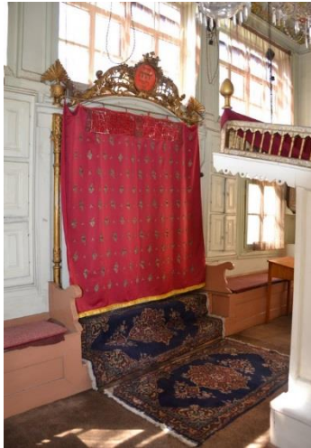
Armoire sainte recouverte du parokhèt

Ilya nous ouvre l'armoire, elle est vide, par crainte des voleurs. Un rouleau de Torah est non seulement sacré, mais aussi onéreux, et celui de cette synagogue sans doute ancien aussi, on le cache. L'armoire sainte est surmontée d'un médaillon, au centre duquel est inscrit le tétragramme, les quatre consonnes imprononçables du Nom de Dieu. Le tétragramme est aussi inscrit sur la paroi intérieure de l'armoire sainte.