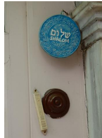
mezouza à l'entrée de la synagogue

Les Sabbatéens sont environ 2 millions. Ils sont musulmans puisque leur « messie » s'est converti à l'islam. On les appelle en Turquie des dönme ou apostats ; certains se considèrent comme des crypto-juifs, d'autres musulmans à part entière, selon tout l'éventail des possibilités. Tous restent méfiants à leur égard. Les Musulmans refusent de leur donner leurs filles en mariage, traitent difficilement affaire avec eux, les laissent à l'écart. Ils ont leur mosquée, Teşvikiye Camii, à Şişli, un cimetière à Feriköy et un autre sur la rive asiatique à Üsküdar ; sur leurs tombes on trouve des symboles cabbalistiques Yakin et Boaz, les noms de deux colonnes du Temple de Jérusalem. Ils n'ont pas une pratique religieuse développée. Récemment, l'un d'eux a demandé au Grand Rabinat à redevenir juif, cela lui a été refusé ; il a alors déposé une demande auprès des tribunaux turcs qui ont reconnu son droit à être juif.