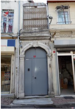
Synagogue Yanbol à restaurer

Quelques synagogues à Balat, au-dessous des inscriptions en turc ou en hébreu :