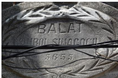
Nom en turc année en hébreu