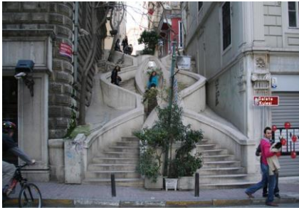
Escalier Camondo à Galata

La maison Camondo au 6 rue Camondo, en haut de l'escalier Camondo, construit dans le style Art Nouveau où les touristes aiment aujourd'hui se prendre en photo, fut louée à l'Alliance Israélite Universelle qui y installa une école de garçons. Au 8 rue Camondo, la famille ouvrit une maison d'Édition, ha-mizra'h , qui publiait des livres d'études hébraïques.