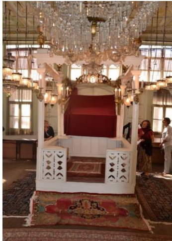
La tevah ou chaire

Le sol est recouvert de moquette et de tapis. Des bancs de bois courent le long des murs, comme dans les synagogues antiques. Quelques-uns, mobiles, ont été rajoutés pour les jours, désormais anciens, d'affluence. De larges fenêtres font de cette salle une pièce lumineuse.