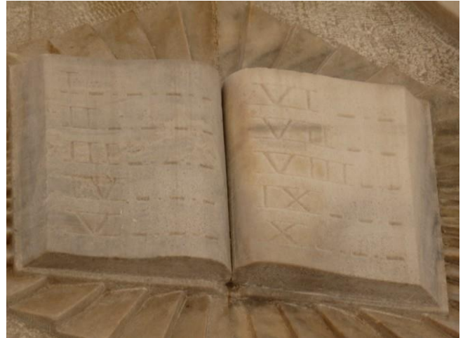
Détail: la Torah (Décalogue)

Au XIX e siècle, le quartier Galata était devenu surpeuplé et beaucoup partirent vers les villages de Kuzguncuk ou d'Ortaköy. Cette population ashkénaze était majoritairement pauvre, soutenue économiquement par les autres communautés, minoritaires parmi les minoritaires.