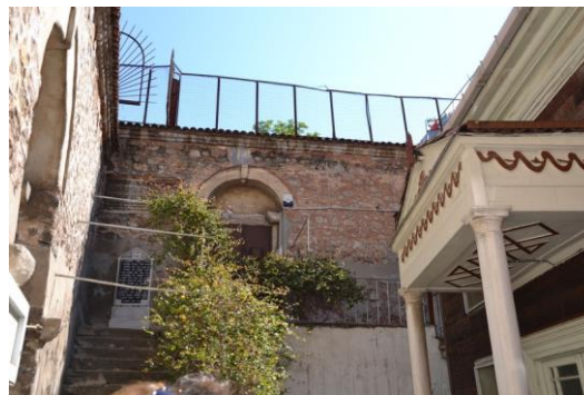
Synagogue caraïte dite "souterraine" Hasköy

Nous arrivons à la Synagogue des Enfants de la Torah Ecrite , nom courant des synagogues caraïtes: aucun signe extérieur n'indique un bâtiment juif, mais les hauts murs, comme souvent autour des églises grecques ou arméniennes, sont surmontés de grillages pour en rendre l'accès difficile aux curieux mal intentionnés.