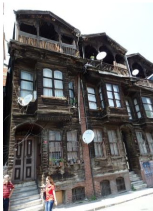
Maison en bois à Ichtipol