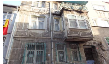
Rue Toptanci maison de 1921 à restaurer