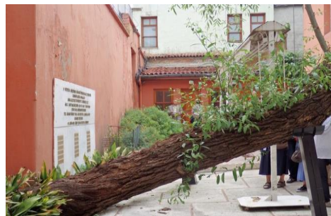
feuillage pour Souccot