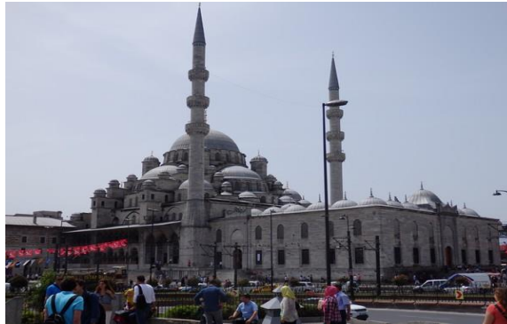
La mosquée Yeni Camii fut construite au XVII e s sur l'emplacement d'une synagogue caraïte

Il y avait dans Istanbul douze synagogues caraïtes, l'une à Karaköy, une autre à l'emplacement actuel de Yeni Cami, de l'autre côté du Pont Galata.