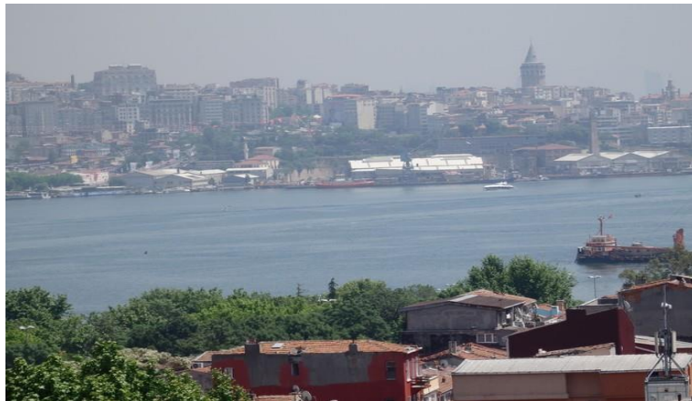
Vue sur la Corne d'Or et la Tour Galata depuis Balat

Depuis 1987, c'est la troisième fois que je me trouve réinstallée à Istanbul pour y travailler. Le premier séjour fut l'occasion de découvrir l'incroyable diversité des communautés qui vivent dans cette cité toute empreinte d'histoire.