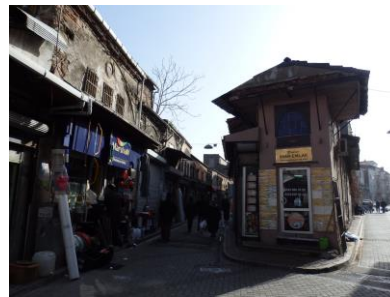
Rues de l'ancien bazar