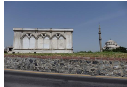
Mausolée Camondo à Hasköy

A la fin des années 1860, les Camondo possédaient aussi l'Alcazar d'Amérique à Pera, des immeubles d'habitations et des magasins, un yali 32 à Yeniköy.