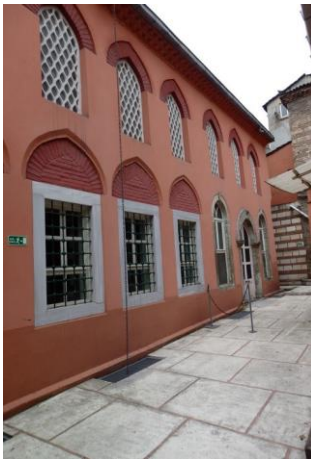
Synagogue Ahrida façade

Ce sont les disciples de Sabbataï Tsevi, faux-messie juif qui au XVII e siècle, après les terribles massacres de Bogfan Khmielnitski en Pologne et en Ukraine, rassembla autour de lui des Juifs de tous pays qui quittèrent tout pour le suivre jusqu'à Izmir. A Istanbul, il prêcha dans la Synagogue Ahrida, dans le quartier de Balat. Alors que ses prédications et son charisme commençaient à être cause de troubles dans la ville, la Sublime Porte somma Sabbataï Tsevi de se convertir, faute de quoi, il serait décapité. Il se convertit donc à l'islam suivi de nombreux disciples.