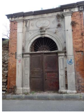
Synagogue Kastoriya, aujourd'hui derrière la porte un parking