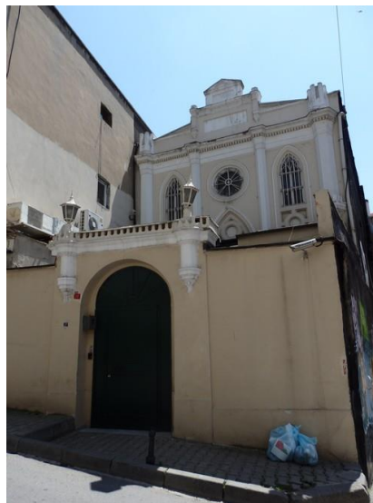
La synagogue italienne à Galata

Le XVIII e siècle fut aussi marqué par l'arrivée des Francos, Juifs d'Italie, aux mœurs très européanisées qui s'assurèrent la protection des consuls étrangers et finirent par se séparer pour constituer la communauté juive italienne ; c'est pourquoi on trouve à Galata une synagogue italienne.