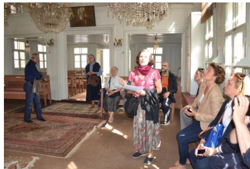
Des tapis comme à la mosquée

Le sol est recouvert de moquette et de tapis. Des bancs de bois courent le long des murs, comme dans les synagogues antiques. Quelques-uns, mobiles, ont été rajoutés pour les jours, désormais anciens, d'affluence. De larges fenêtres font de cette salle une pièce lumineuse.