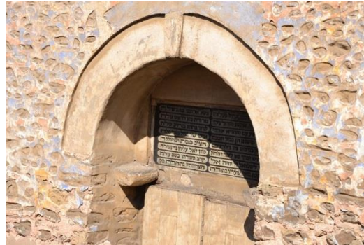
Porte d'entrée côté intérieur – inscriptions en hébreu

Ilya nous ouvre la porte, coupe le système d'alarme et nous voici dans la cour. La porte principale à deux battants reste fermée, elle est surmontée d'inscriptions en hébreu.