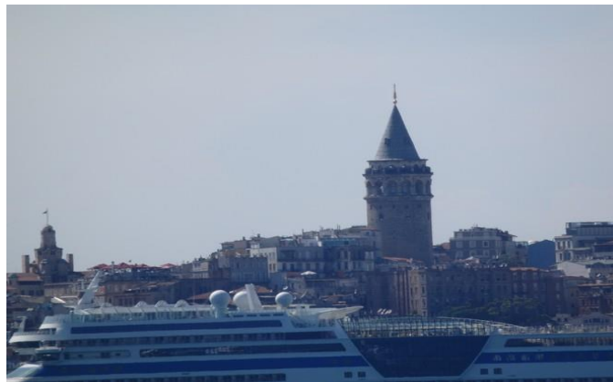
La tour Galata sur la rive européenne d'Istanbul

Depuis le XIV e et au fil des siècles arrivèrent aussi d'Europe centrale des Ashkénazes : venus de Pologne, de Lituanie, d'Allemagne, au gré des pogroms et autres difficultés. A Istanbul on les appelait les Allemands. Leurs relations avec les autres communautés juives étant parfois houleuses, les Ottomans les placèrent sous la protection de l'Autriche-Hongrie, ce qui évita leur assimilation sous la vague déferlante des Sépharades. Ils parlaient yiddish. La communauté Ashkénaze se développa autour du monastère Saint Georges et de la Tour Galata.