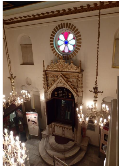
Ancienne salle de prière avec l'arche de la Torah