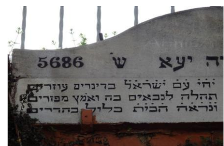
Inscription et date en hébreu

C'était une communauté très dynamique qui apportait des capitaux, un savoir faire et des connaissances, qui avait de nombreux contacts en Europe : ils brillèrent au XVI e et XVII e siècles, même s'ils avaient, comme tous les non Musulmans, le statut de dhimmis 24 , qui marquait clairement leur infériorité sociale par rapport aux Musulmans. La communauté négociait avec les autorités la construction de synagogues, la fondation de cimetières. Le système ottoman laissait à chaque communauté religieuse l'autonomie de ses affaires internes (mariages, conflits, jugements, écoles,