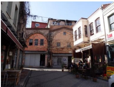
Entrée de Balat

Pourquoi les Ottomans furent-ils, au XV e siècle, si favorables à l'accueil des Sépharades, les Juifs de la Péninsule ibérique? La prise de Constantinople était encore toute récente, les Grecs avaient fui la ville qu'il fallait repeupler: on commença par déplacer des communautés, par exemple la communauté juive de Salonique ou d'Andrinople (Edirne) vers Istanbul. Puis les Sépharades arrivèrent en deux vagues à la fin du XV e siècle. Ils s'installèrent dans les villages de Balat et de Hasköy.