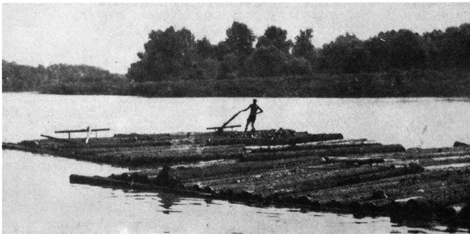
Többláblás tutaj a kormányossal. Paksi Vízügyi Múzeum.