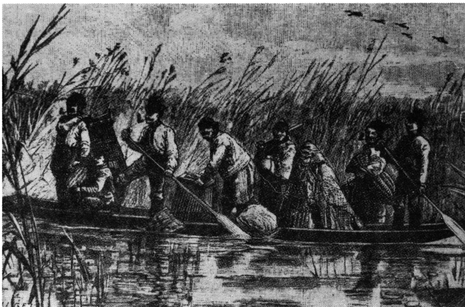
Pákászok a lápon.