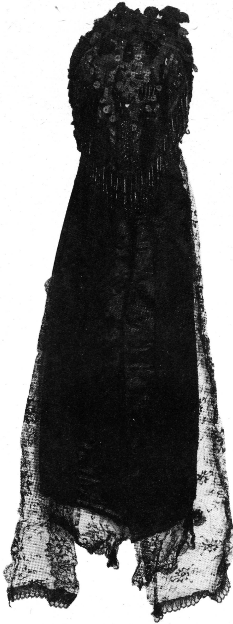
23. Nagy főkötő, „fikötő”.