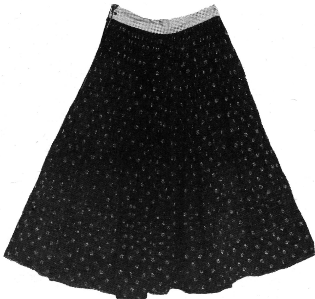
21. Szoknya (fél bősége kiszedve).