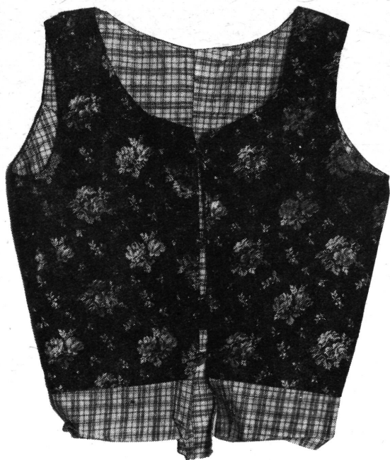
20. Selyemmellény „pruszlik”.