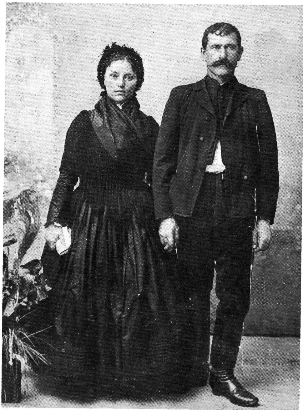
8. Dobozi házaspár a tízes években.