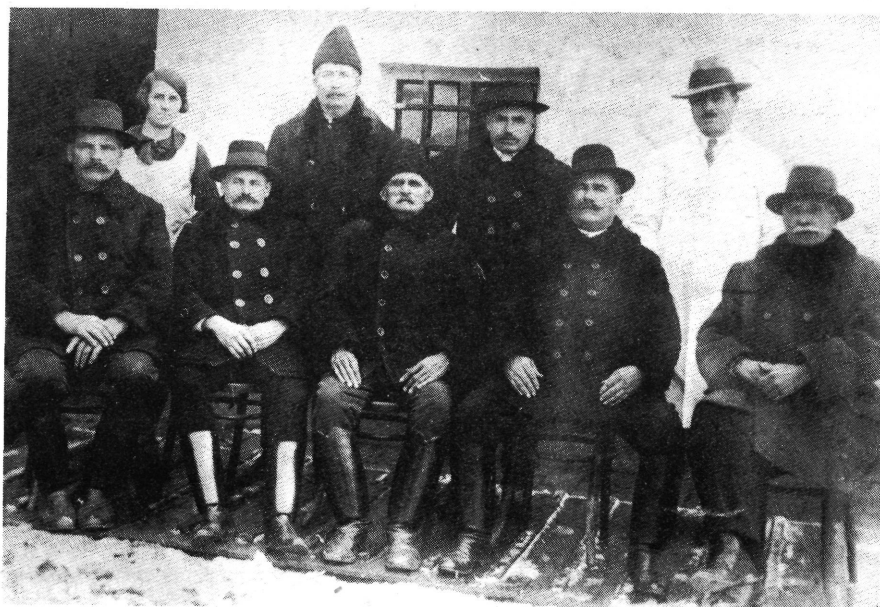
14. A Hangya Szövetkezet vezetősége a harmincas években.