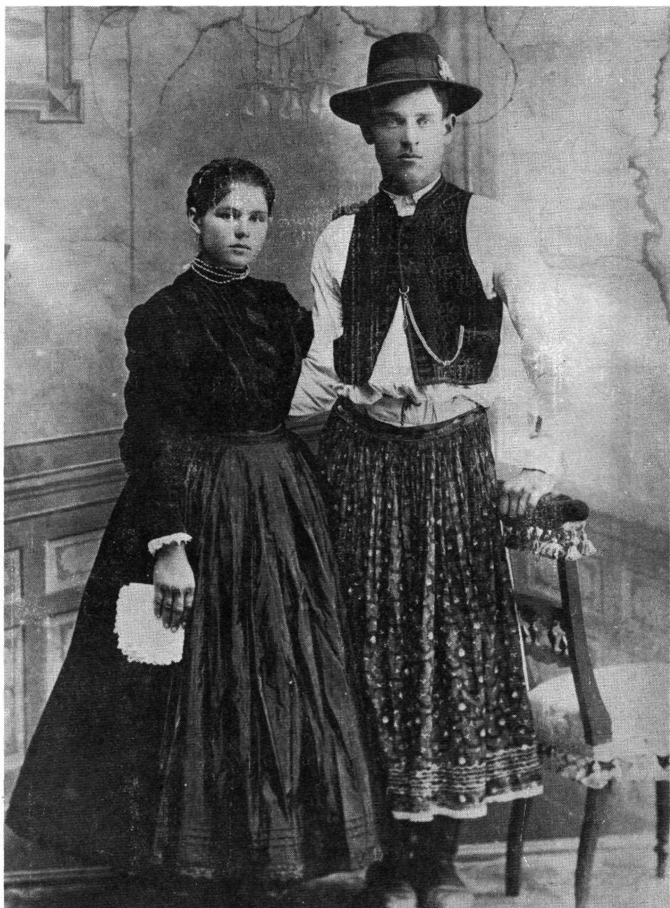
4. Dobozi pár a századfordulón.