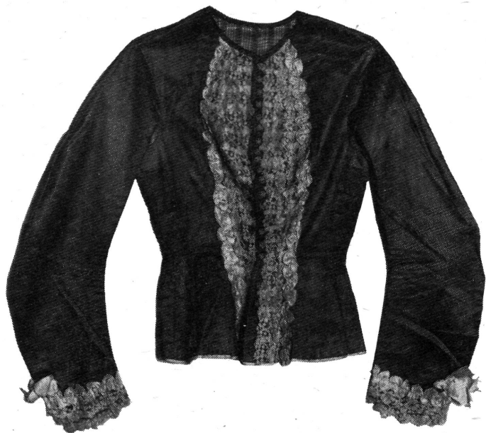
22. Selyem újjas „blúz”.