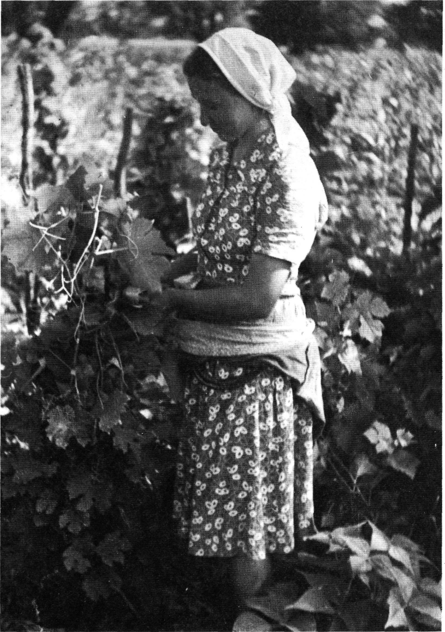
18. Fialalasszony munkaruhában 1954-ben.