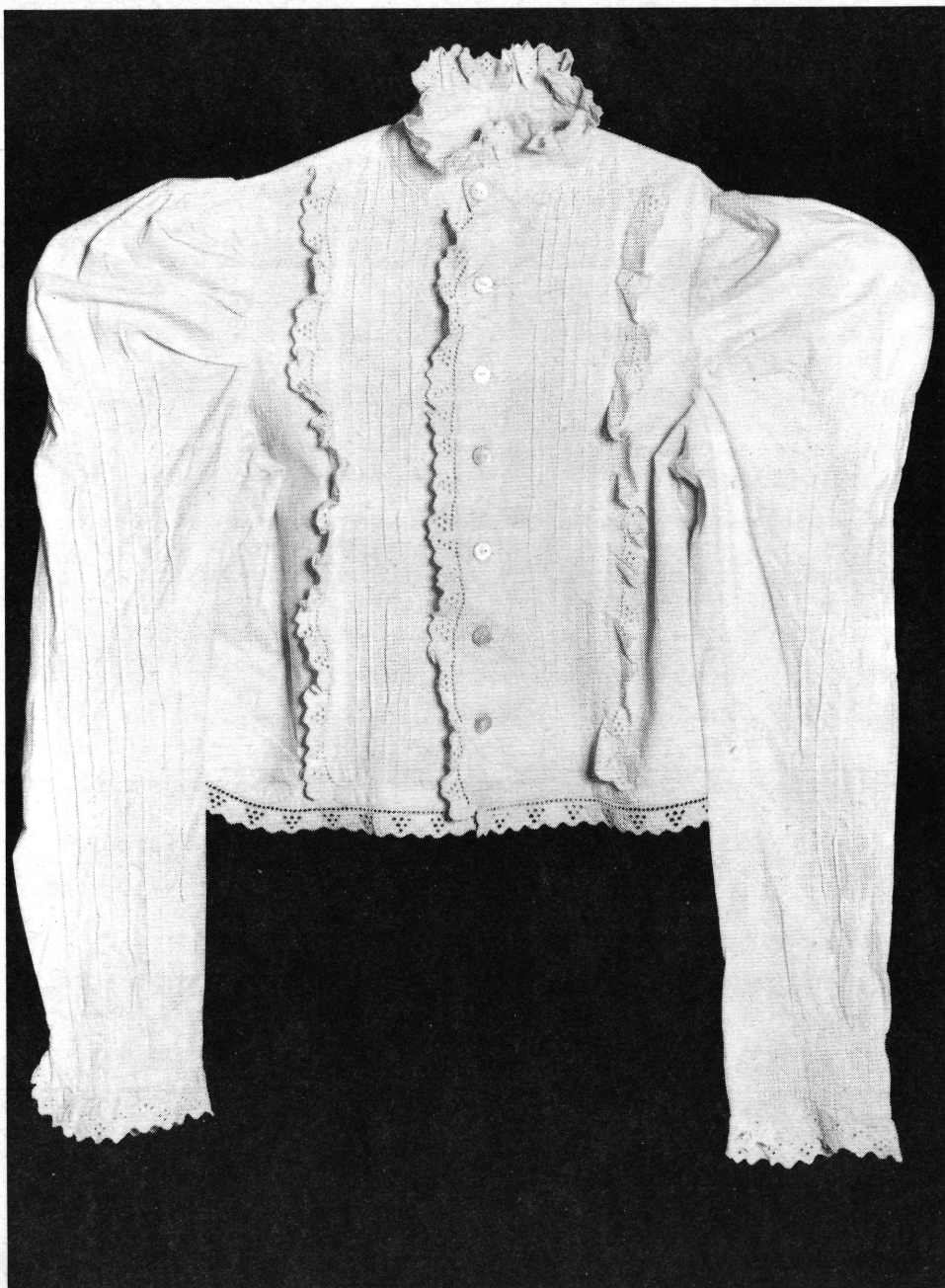
19. Női gyolcsvászong slingolt díszítéssel.