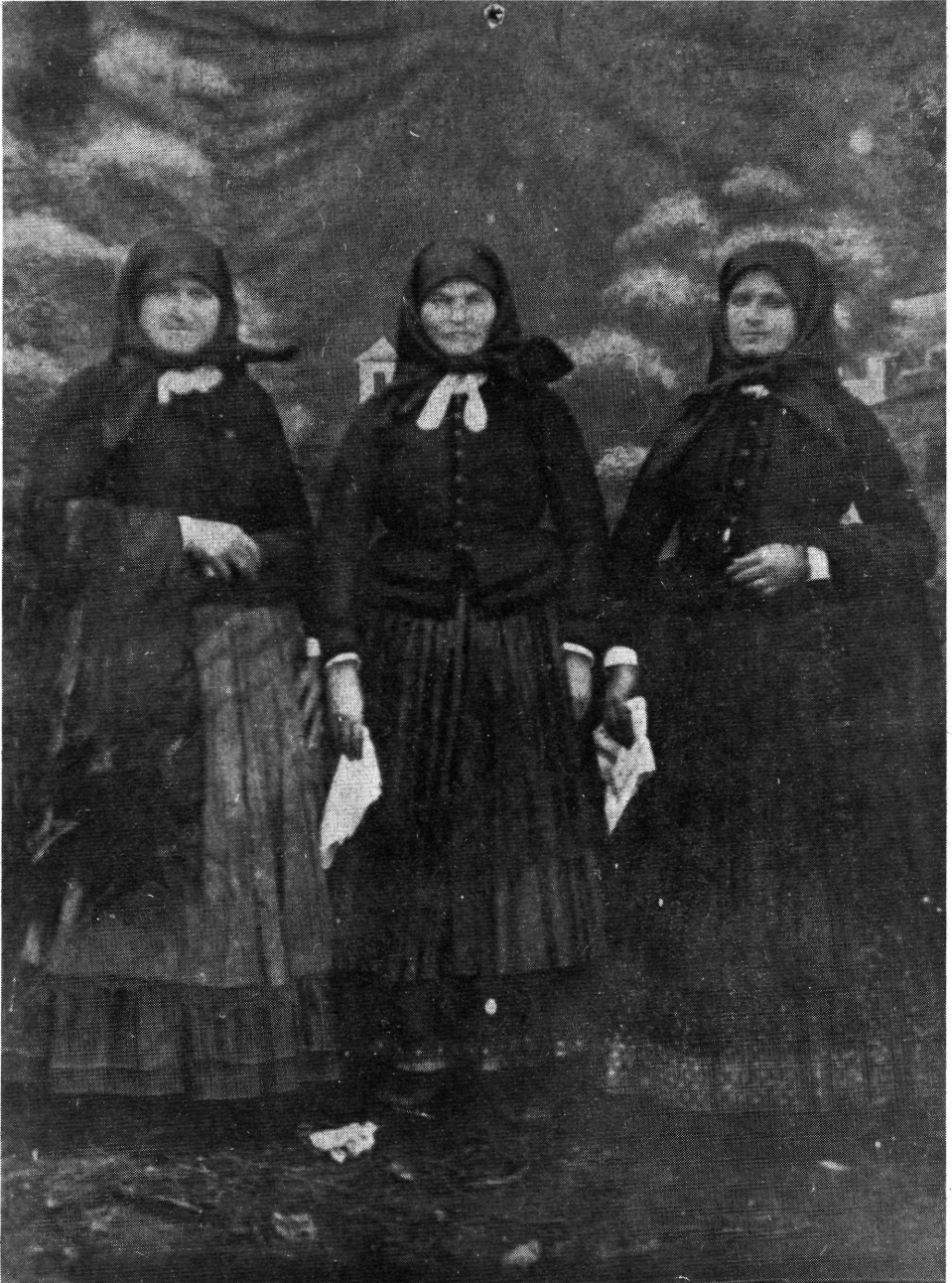
3. Idős dobozi asszonyok a múlt század második felében.