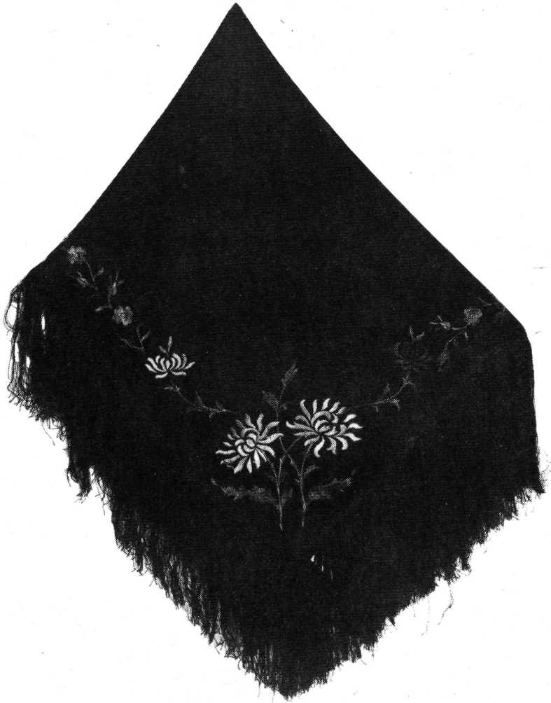
24. Színes kézi hímzésű fekete vállkendő