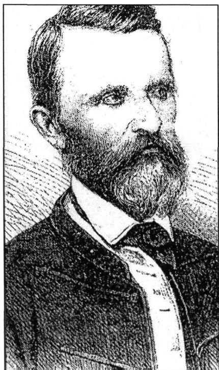
1. kép. Pálffy Albert (1820–1897)