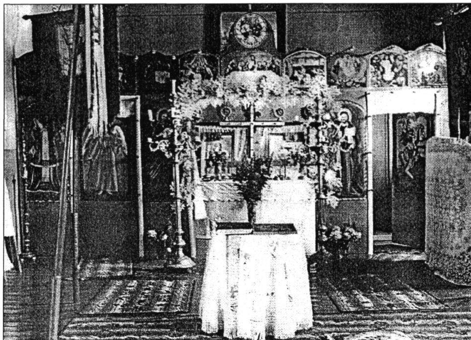
2. kép. A román ortodox kápolna ikonosztáza, Elek