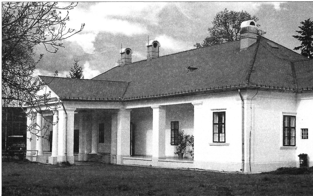
3. kép. A Steiner- (Omaszta-) kúria ma Munkácsy Emlékház Fénykép

Steinerék is a közelben laktak. A téren átvágva jutottak el a Körös-csatornát átívelő hídon a gyulai útra, melynek jobbról első épülete Omaszta alispán háza volt, mellette a klasszicista stílusú Steiner-kúria. Nem a „város legvégén” ugyan, mint Munkácsy írja, hanem a főtértől 2–300 méterre csupán. Mert Csaba városszerkezetének az a különlegessége, hogy a városközpont a vá-