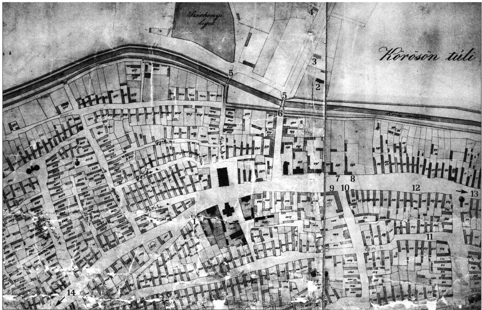
A tanulmányban leírt események színhelye 1. Reök és Miska első csabai lakása. 2. Omaszta Zsigmond. 3. Steiner-ház. 4. Szulimánék háza. 5. Az Élővíz-csatorna hídja. 6. A vásári mulatozás valószínű színhelye. 7. Reök és Miska második lakása. 8. Vidovszkyék. 9. A csabai nagyvendéglő. 10. Bartókyék. 11. Lang György háza. 12. Munkácsy lakása 1865-ben. 13. Gerendás felé. 14. A Szarvasi úti temető.