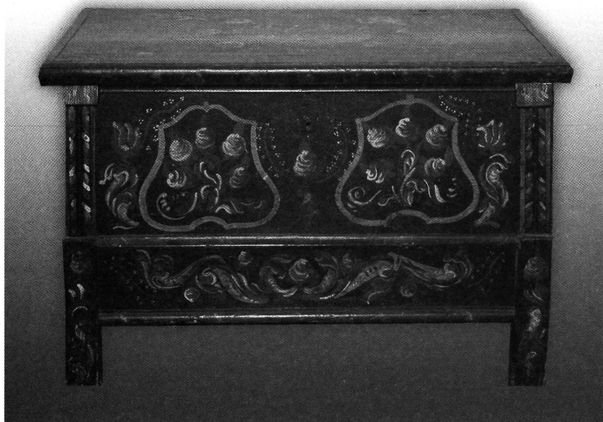
5. kép. Munkácsy tulipántos ládája Munkácsy Mihály Múzeum, Békéscsaba

De folytassuk az „öreginas” életének bemutatását!