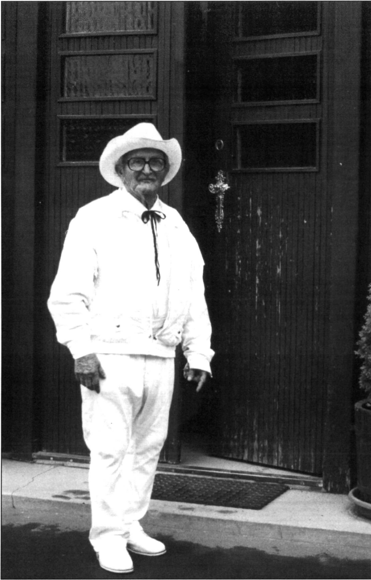
A Városháza kapujában. Ügyes-bajos dolgaival gyakran megfordul a Városházán