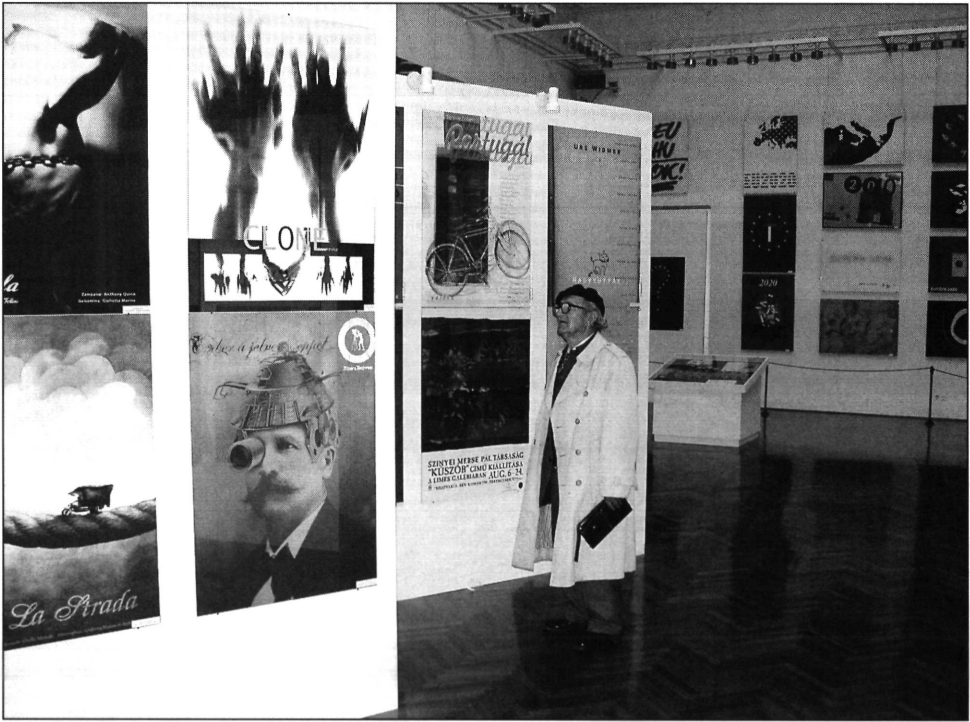
A Munkácsy Mihály Múzeumban, a Tervezőgrafikai Biennálé legutóbbi, 2004. évi tárlatán