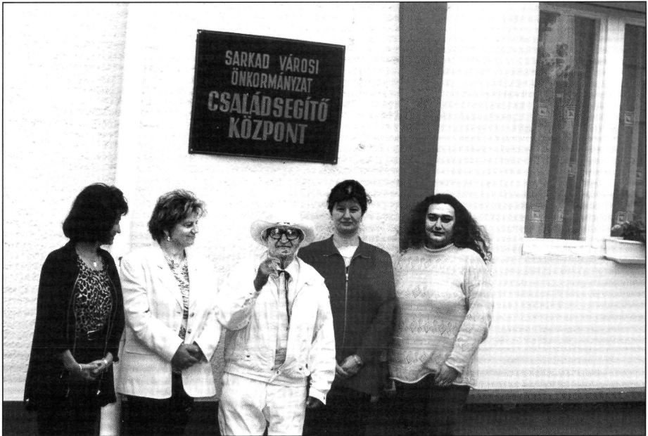
A városi Családsegítő Központ munkatársaival, akiknek a segítségére mindig számíthat