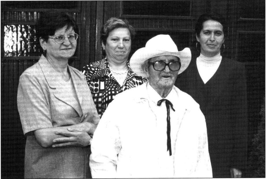
Sarkad Város Önkormányzati Hivatala munkatársaival