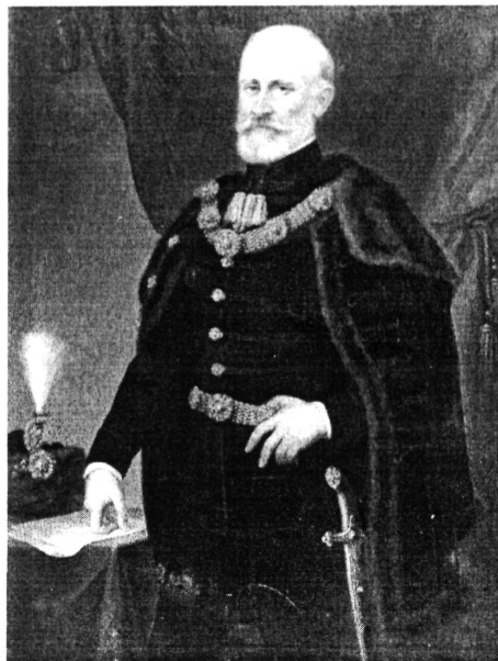
9. kép. Szamosy Elek: Báró Wenckheim László (Kat. 27.)