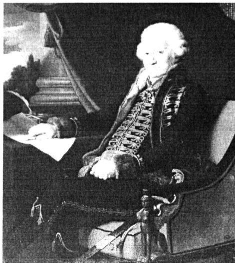
2. kép. Peter Krafft: Báró Bedekovich Ferenc (Kat. 3.)