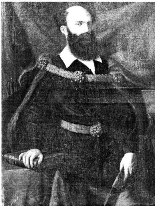
1. kép. Szemplér Mihály: Gróf Batthyány Lajos (Kat. 2.)