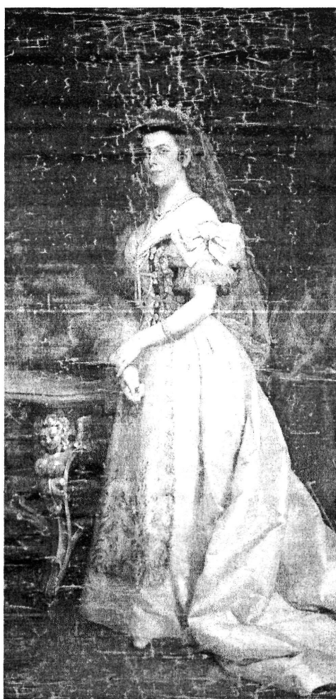
5. kép. Id. Vastagh György: Erzsébet királyné (Kat. 7.)