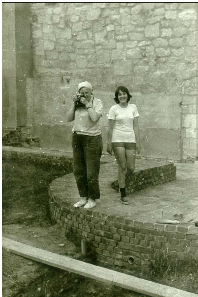
3. kép. Fotózás Feldebrón