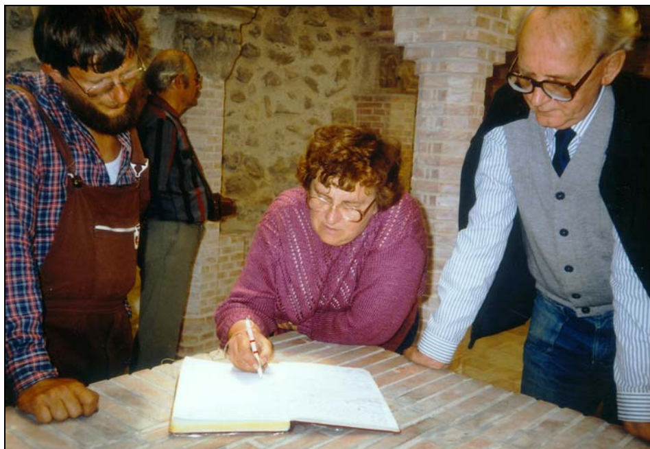
6. kép. Beírás a vendégeknyvbe