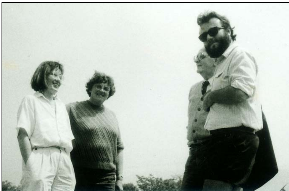
5. kép. Látogatás Visegrádon