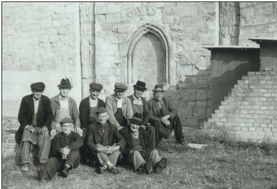
4. kép. A feldebrői ásatási munkások