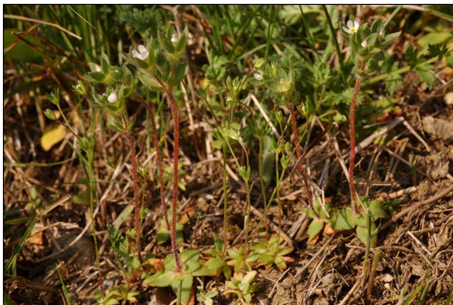
6. kép. A nagy gombafű ( Androsace maxima ) és a cingár gombafű ( Androsace elongata ) egy helyen nő Gyomaendrőd mellett