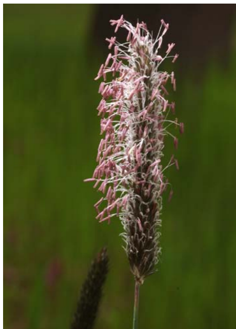
7. kép. A réti ecsetpázsit ( Alopecurus pratensis ) virágzata