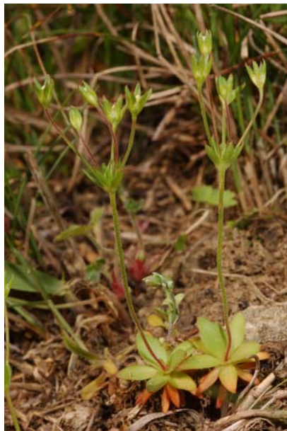
5. kép. Cingár gombafű ( Androsace elongata )