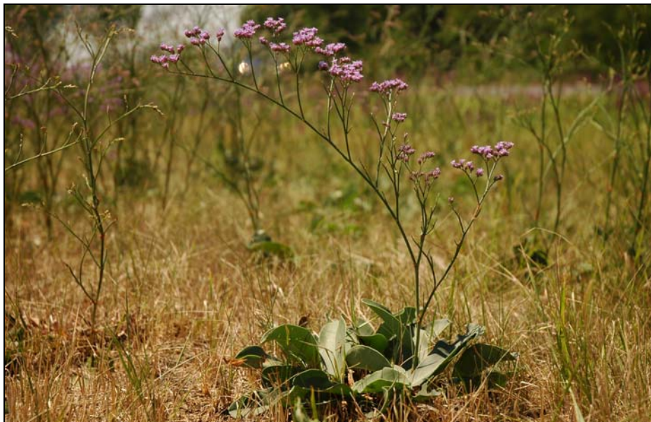
11. kép. A szikes talajokat jelző sziksófű ( Limonium gmelinii ssp. hungaricum )