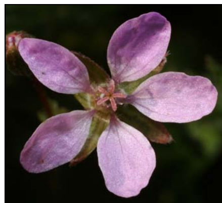
10. kép. Bürök gémorrr ( Erodium cicutarium )