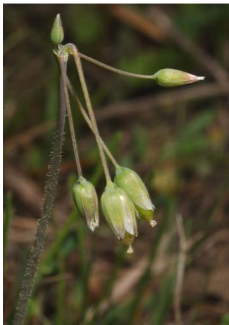
8. kép. Olocsán ( Holosteum umbellatum )