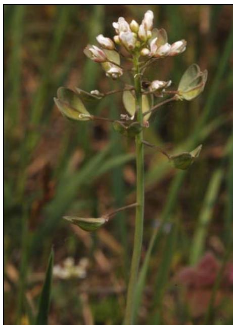
9. kép. Pásztortáska ( Capsella bursa-pastoris )