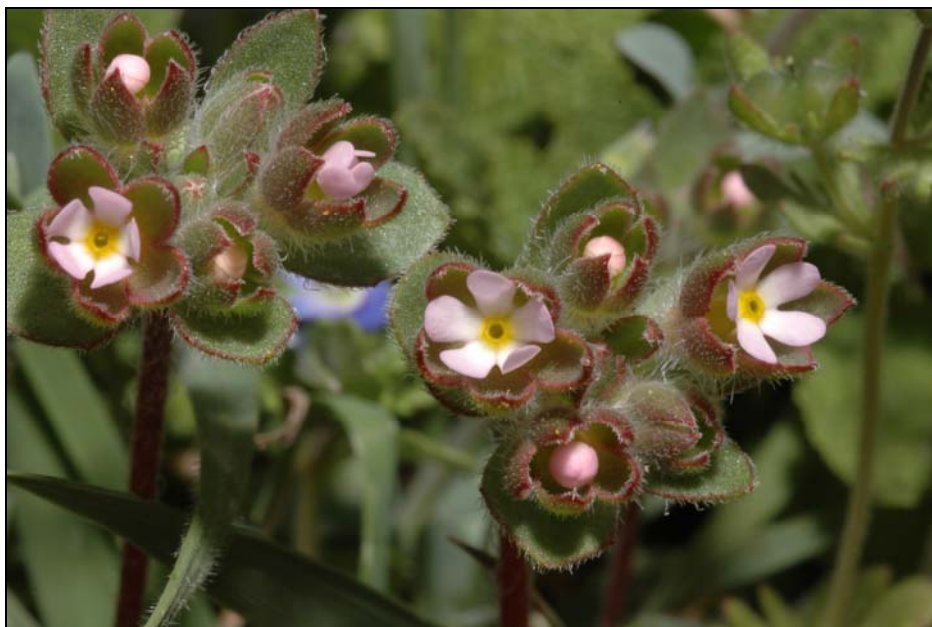
3. kép. A nagy gombafű ( Androsace maxima ) csészelevelei és a szárai többnyire barna színűek, szőrösek