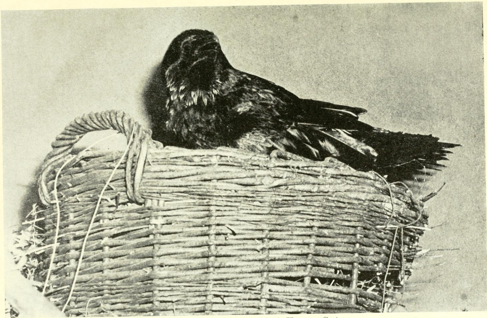
22. ábra. A tojó a fészken Figure 22. The female on the nest