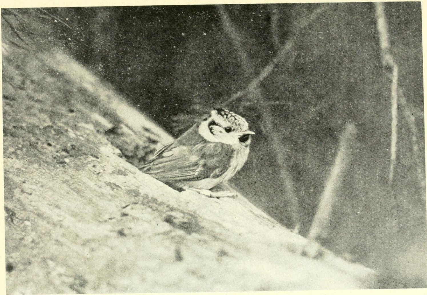
26. ábra. Fészkéről kijövő búbosinege-fióka Figure 26. Crested Tit young, coming out of its hole