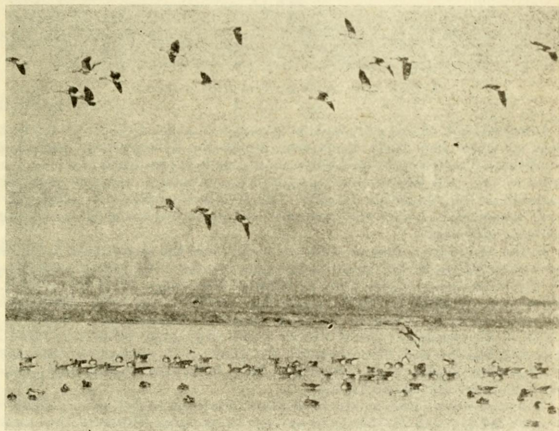
1. Lesser White-fronted Geese. Kardoskut, 31. 10. 1969. – Kisilikek Kardoskúton. 1969. okt. 10.