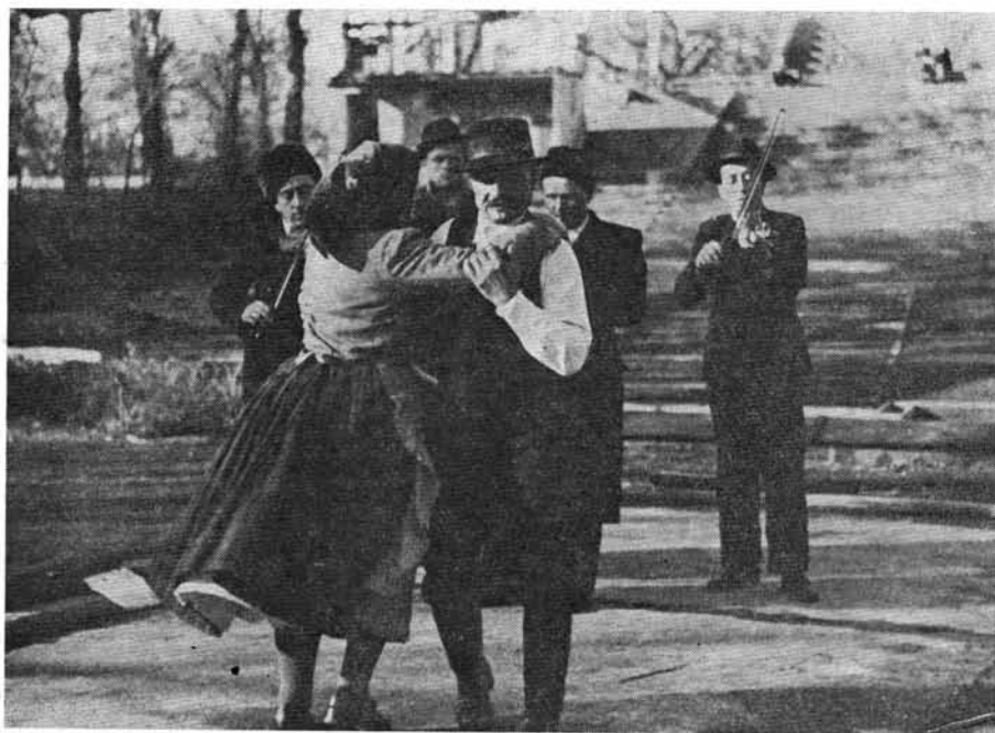
Friss ( Ács György tánca)