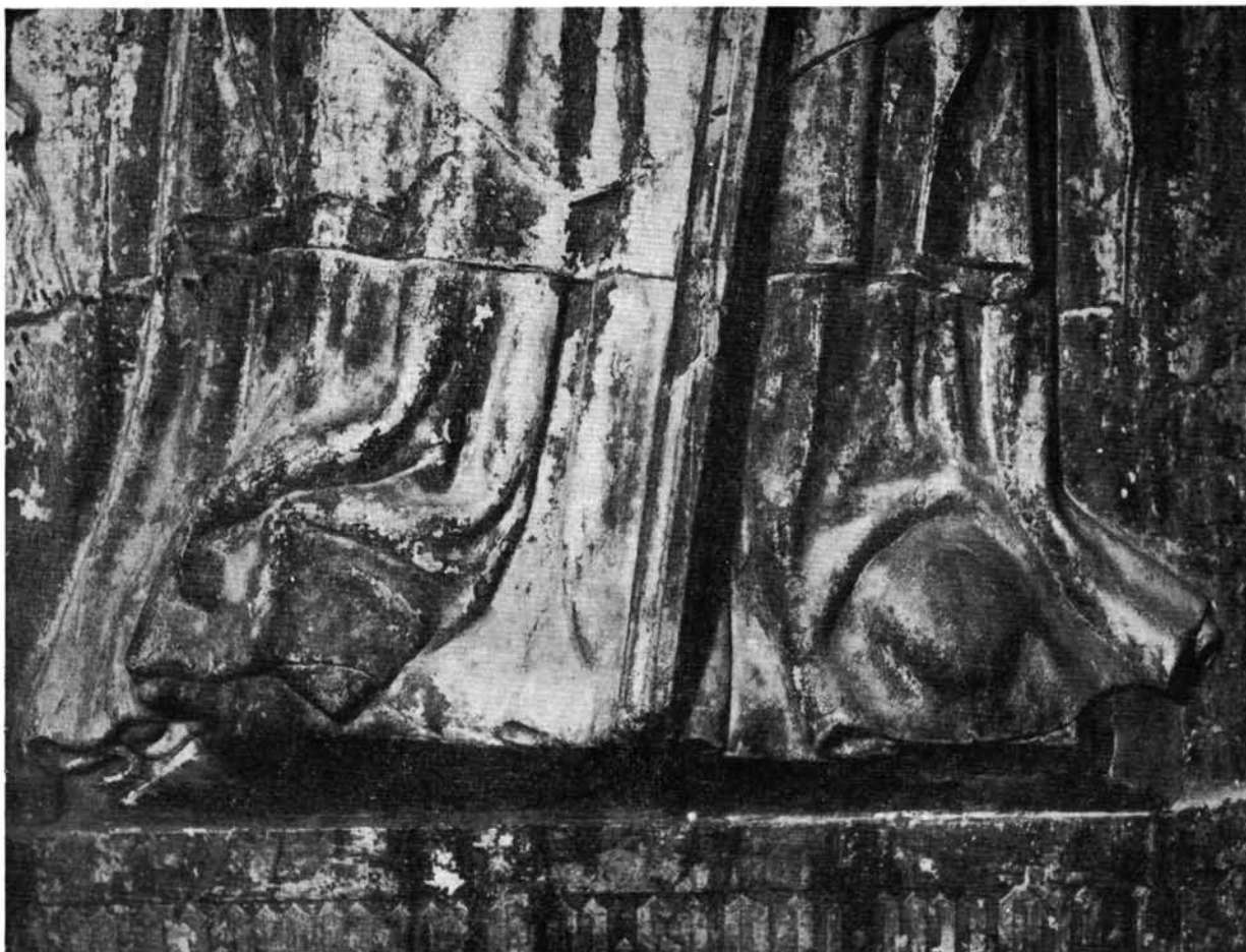
6. Részlet Széchy Dénes érsek (+1465) esztergomi sírkövééről 6. Detail von Grabstein des Erzbischofs Dénes Széchy (+1465) in Esztergom.