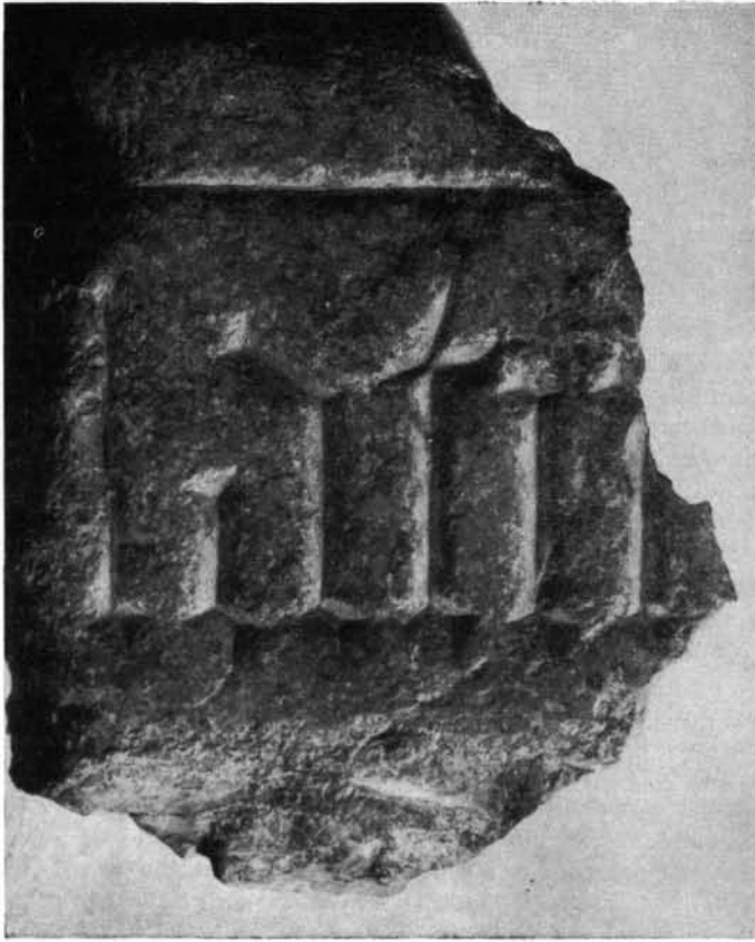
3. A 75. sz. vörösmárvány sírkőtöredék 3. Bruchstück eines Grabsteines aus rotem Marmor N° 75. 3. Fragment de la pierre tombale en marbre rouge, n° 75. 3. Фрагмент надмогильного камня из красного мрамора № 75.

dőzetű szegélyének egy darabkája is fennmaradt a kövön.