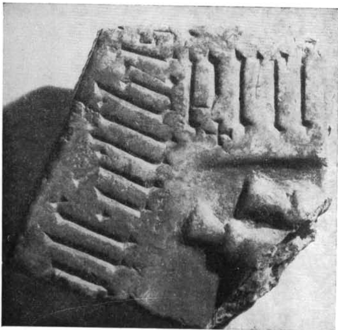
2. A 74. sz. vörösmárvány sírkőtöredék 2. Bruchstück eines Grabsteines aus rotem Marmor N° 74. 2. Fragment de la pierre tombale en marbre rouge, n° 74. 2. Фрагмент надмогильного камня из красного мрамора № 74.

hogy korai sírköveinkről a körirat és a figurális ábrázolás legtöbbször hiányzik, a címer és a kereszt pedig olyan helyzetben is elképzelhetők, hogy a kő fennmaradt részletén nem feltétlenül kell jelentkezniük. Ehhez járul az, hogy faragványunk méretei (jelenlegi teljes szélessége 85, vastagsága kb. 20 cm) inkább síremlékre vallanak, és feltételezhető egykori alakja is — a ránk maradt részlet bizonyára egy hosszanti irányban elnyúló mélyített mező részsűs profilú keretelésének záradékát alkotta — a síremlék-formátumhoz állhatott közel.