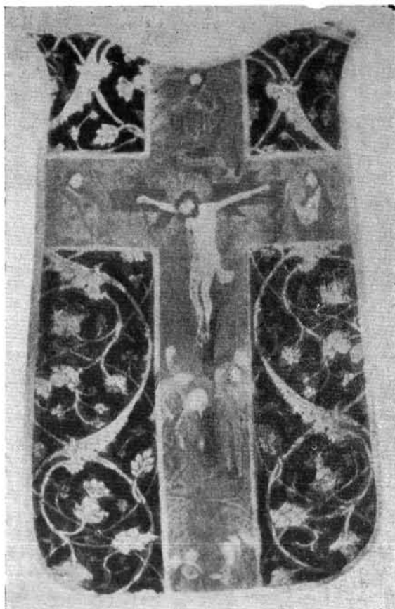
2. Olasz bársonyú miseruha a XV. sz. közepéről. 2. Messgewand mit italienischem Samt vom Ende des XV. Jhs. 2. Chasuble en velour italien du milieu du XVe siècle. 2. Итальянская бархатная риза. Середина 15. в.

A veszprémi miseruha hátán egyenes szárú hímez-