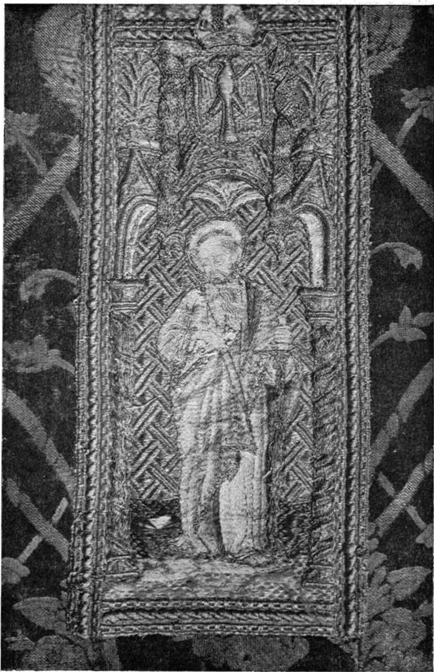
4. Részlet a Vetési miseruha hímzéséből. Keresztelő Szent János alakja. 4. Detail der Stickerei des Messgewandes von Vetési. Die Figur des Johannes d. Taufers.