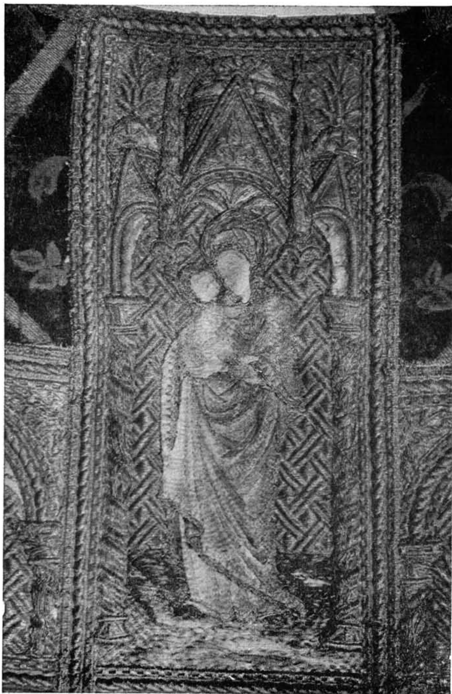
3. Részlet a Vetési miseruha hímzéséből. Madonna a Gyermekkel. 3. Detail der Stickerei des Messgewandes von Vetési. Madonna mit dem Kind.