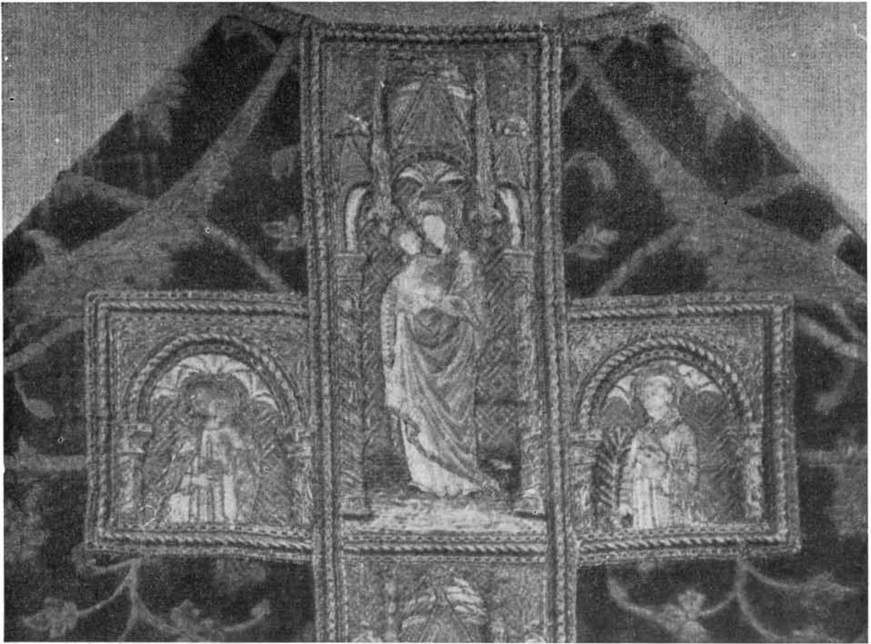
7. Részlet a Vetési miseruha hímzéséből. 7. Detail der Stickerei des Messgewandes von Vetési.