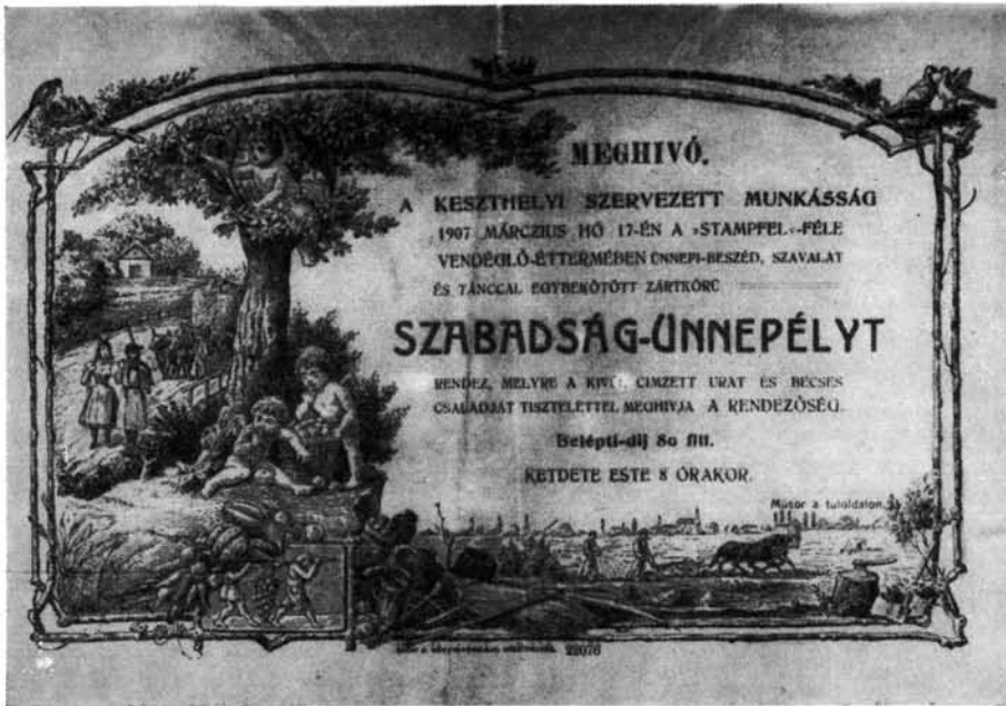
4. A keszthelyi szervezett munkásság meghívója. 1907. márc. 17. 4. Einladungsbrief der organisierten Arbeiterschaft von Keszthely, 17. März. 1907.