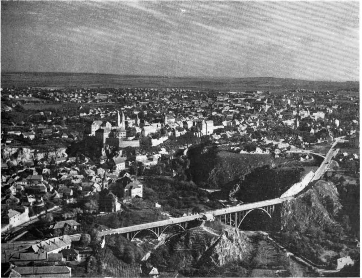
6. A Vár és a város képe a Betekints völgy felől, előtérben a Dózsa György út viaduktos szakaszával. 6. Ansicht von Burg und Stadt vom Betekints-Tal aus; im Vordergrund Teil der Talbrücke am Dózsa György út.