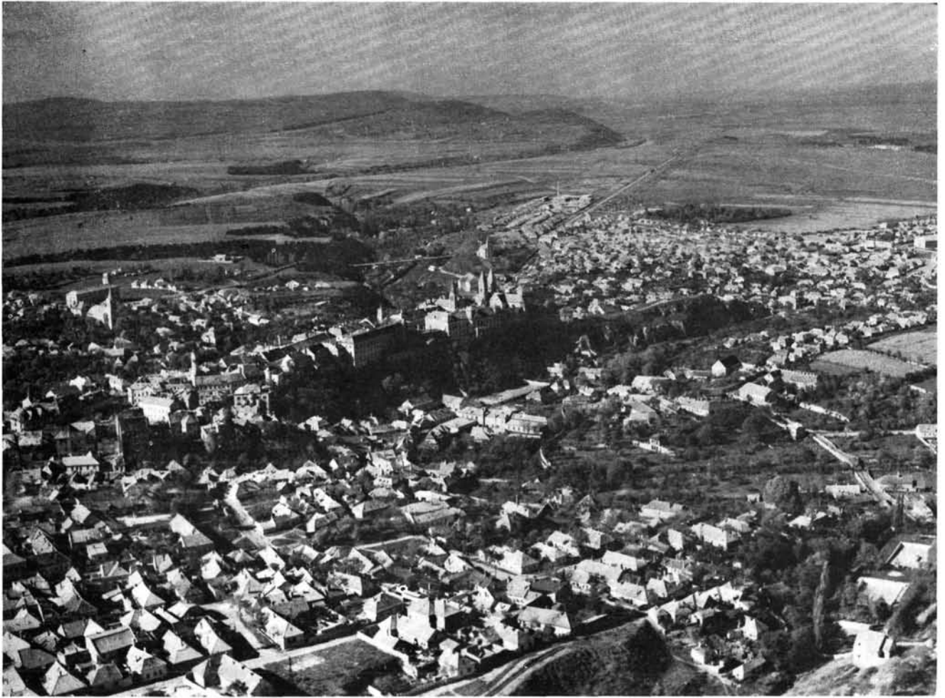
1. A Vár kelet felől. 1. Die Burg von Osten her.