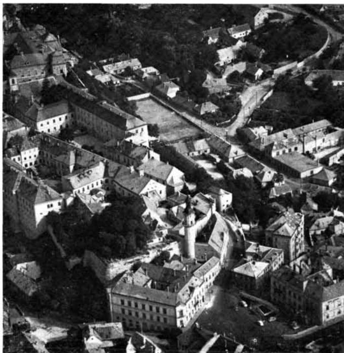
4. A Vár déli része. 4. Südteil der Burg. 4. Partie sud du château. 4. Южная часть крепости.

get tizedének átengedése fejében — a veszprémi püspökségnek adományozta. A királyi ispánság önállóságának ilyen módon való megszüntetése nem elszigetelt jelenség. Elsőnek az esztergomi érsek érte el célját, az ispáni vár megszerzését. Utána — Veszprémen kívül — sorra püspöki erődtéménnyé minősült a nyitrai, szerémi és a gyulafehérvári ispáni vár. Ehhez a veszprémi püspök még a teljes bírói jogkör királyi elismertetését is megszerezte (1324-ben). 13