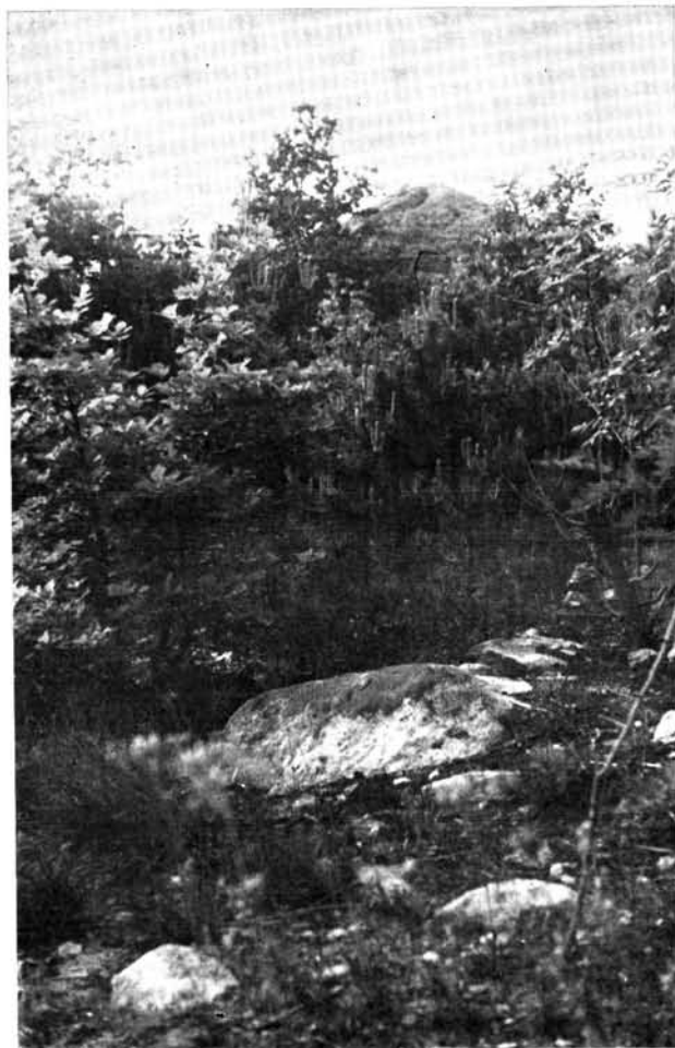
1. A lappantyú fészkelőhelye a Tóti-hegy oldalában