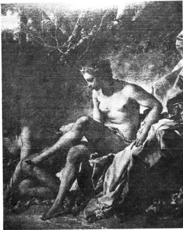
Abb. 7. Francois Boucher: Diana nach dem Bad. Öl. Detail. 1743.