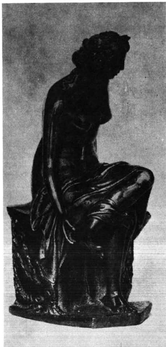
4. ábra. Reneszansz kisplasztika, bronz. (antik utánszat). Abb. 4. Renaissance-Kleinplastik. Bronze (antike Nacharbeit).

az időben, de még inkább a társadalmi körülményekben lévő hasonlatosság az itáliai kora reneszánsz és a németalföldi reneszánsz mesterek munkái között, együttesen is visszautalók a kompozíciók ikonográfiai alapjaikban az antik előképekre. Adrien de Vries Herkules kútjának életnagyságú alakjain a firenzei és római manierizmus hatása érződik. Szembetűnő ez a testek részletformáinak mintázásában, a nagy méret ellenére is megmutatkozó erőtlenségben, a kompozíció kiszámított hatású felépítésében. Feltehetően a nagyobb együtteshez tartozó egyik előtanulmányként mintázott alakja a dresdai Grünes Gewölbe gyűjteményében lévő, és 1600 körüli készítési időre datált ülő