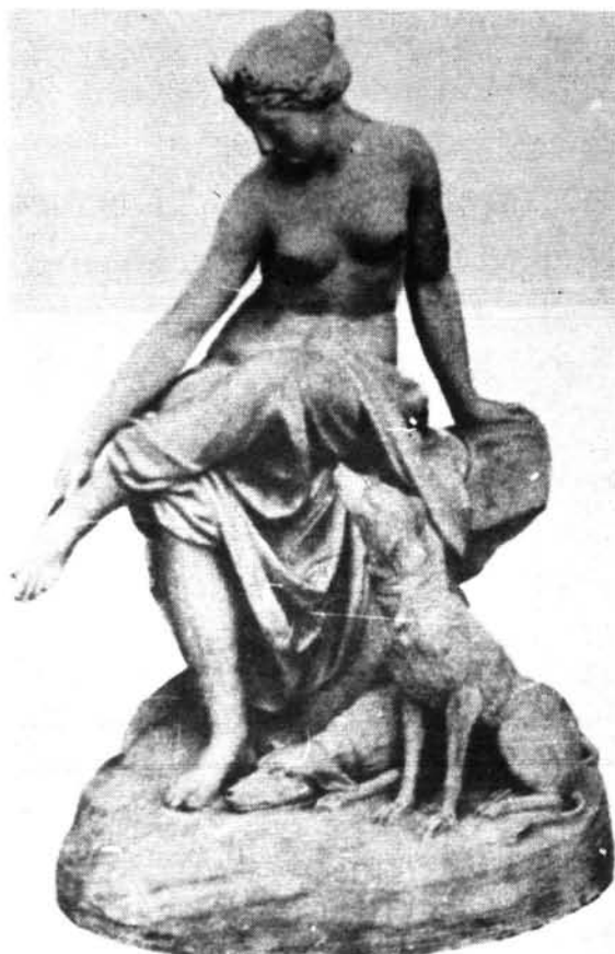
10. ábra. Anton Grassi: Diana, bécsi porcelán 1785 k. Abb. 10. Anton Grassi: Diana. Wiener Porzellan, um 1785

A bécsi császári gyár történetét feldolgozó első jelentős monográfiában kerül először közlésre a Diana, amelyet a szerzők A. Grassinak tulajdonítanak és 1785 körüli, vagy utáni időre datálnak. 17 A kör alakú lapos talpazaton lévő sziklás tömegen ülő ruhátlan nőalak bal lábát keresztbe fekteti jobb térdén. A comb és térd drapériával fedett. A bal karra támaszkodó alak jobb kezével sarkát érinti, fejének iránya, tekintete a kezét követi, haján elől középen holdsarló, lábánál balra egy fekvő és egy ülő kutya. Az erőteljes mintázás kidomborítja az érett testformákat (10. kép). Amennyiben a kompozíció készítője a fenti meghatározás szerint Grassi, úgy azt az itáliai tanulmányútja előtt készítette. A formák még erősen utalnak a kései rokokó plasztikákra, bizonyos mértékben a boucheri Diana felsőtest megfogalmazására, illetve annak plasztikai áttételére. A francia rokokó biszkvittek hatása kimutatható már az 1760-as évek közepétől a bécsi szobrok között. A publikálás idején a Franz Jenny Szent-Györgyi gyűjteményben lévő Dianáról az elmúlt évtizedekben újabb adatokat nem közöltek, reprodukcióját sem mellékeltek. Ezért is