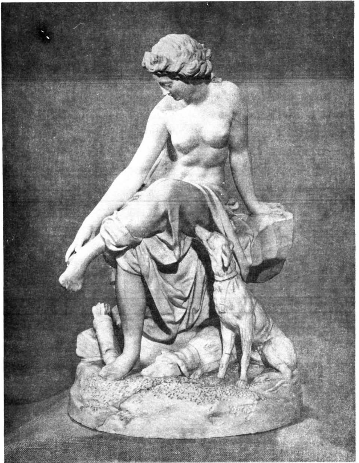
1. ábra. Anton Grassi: Diana, bécsi porcelán 1800 k. Veszprémi Bakonyi Múzeum.