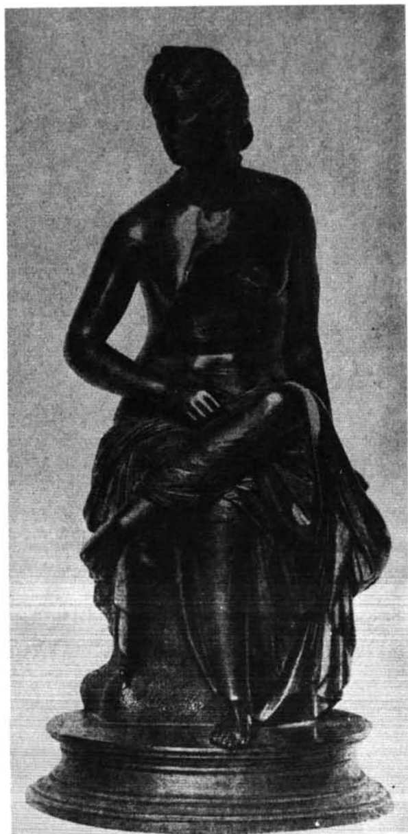
3. ábra. Antik kisplasztika, bronz. Abb. 3. Antike Kleinplastik. Bronze.

az időben, de még inkább a társadalmi körülményekben lévő hasonlatosság az itáliai kora reneszánsz és a németalföldi reneszánsz mesterek munkái között, együttesen is visszautalók a kompozíciók ikonográfiai alapjaikban az antik előképekre. Adrien de Vries Herkules kútjának életnagyságú alakjain a firenzei és római manierizmus hatása érződik. Szembetűnő ez a testek részletformáinak mintázásában, a nagy méret ellenére is megmutatkozó erőtlenségben, a kompozíció kiszámított hatású felépítésében. Feltehetően a nagyobb együtteshez tartozó egyik előtanulmányként mintázott alakja a dresdai Grünes Gewölbe gyűjteményében lévő, és 1600 körüli készítési időre datált ülő