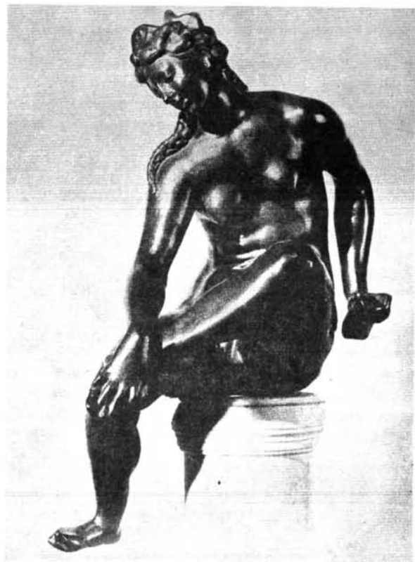
6. ábra. Adriaen de Vries (?): Füldő nő kisplasztika, bronz 1600 k.