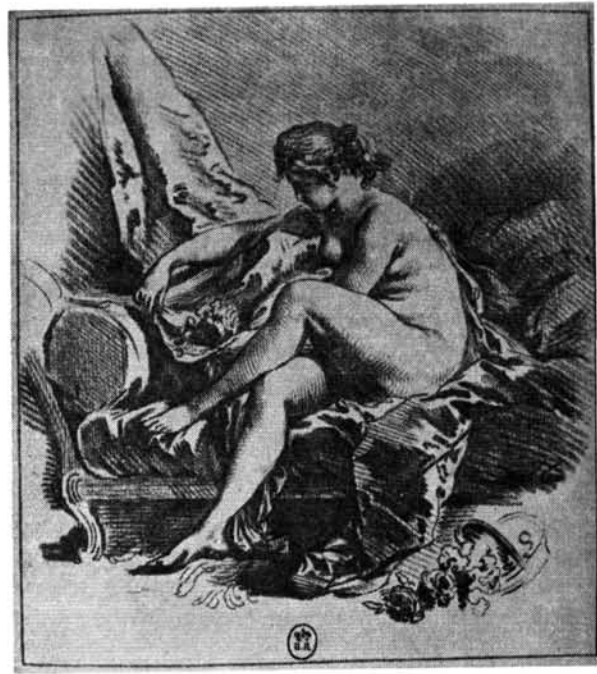
8. ábra. Gilles Demarteau: Női tanulmány (Boucher után). Abb. 8. Gilles Demarteau: Frauenfigur. Studie (nach Boucher).