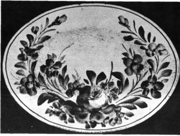
9. ábra. Pecsényétál. Abb. 9. Bratenschüssel.