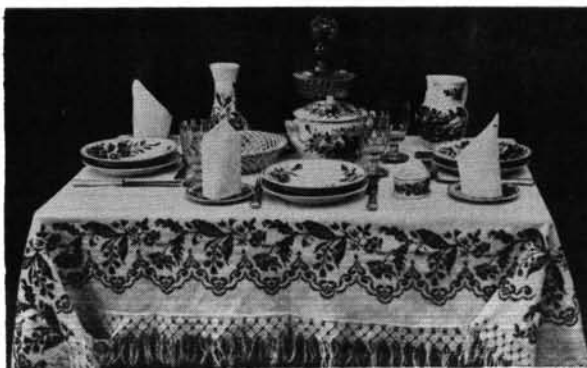
16. ábra. Az étkezésel megterített asztal. Abb. 16. Tisch mit dem Tafelgeschirr gedeckt.

A mártástál a megszokott, ismert, hosszúkásan formált, talpas, nagy füles edény. Ebből a talpas mártástálból három darab került a gyűjteménnyel a múzeumba. Kiegészítője egy-egy ovális tálka, ez a mártástál alja. A mártástál magassága 11,2 cm, szája 22,2 x 8,4 cm-es. A tálka 20,4 cm hosszú és 15,4 cm széles (14., 15., 16. kép). 5