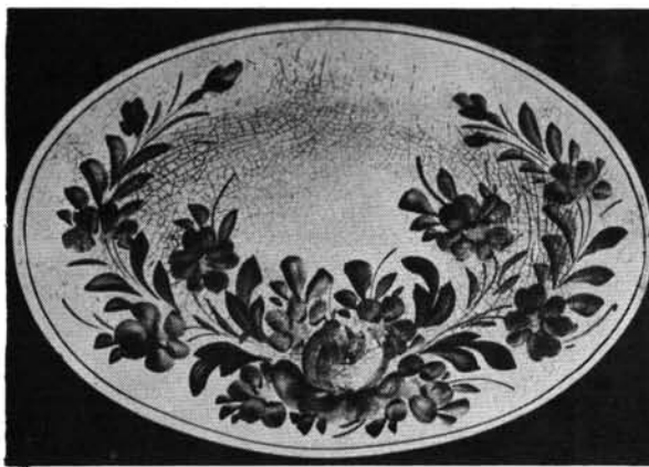
15. ábra. Mártástál alja. Abb. 15. Untersatz der Sauciere.

Három sótartónk a legfiatalabbnak, vagy legkevésbé használtak tűnik az egész együttesben. A kettős osztású só-paprikatartó belül szép fehér zománcú, a virágkoszorúk az oldalán vannak elhelyezve. Magassága 1,7 cm (11. kép).