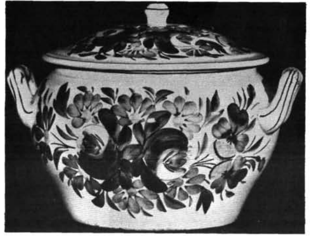
10. ábra. Levesetál. Abb. 10. Suppenschüssel.