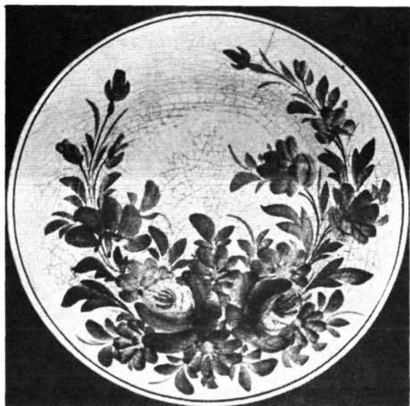
1. ábra. Mélytányér. Abb. 1. Tiefer Teller.