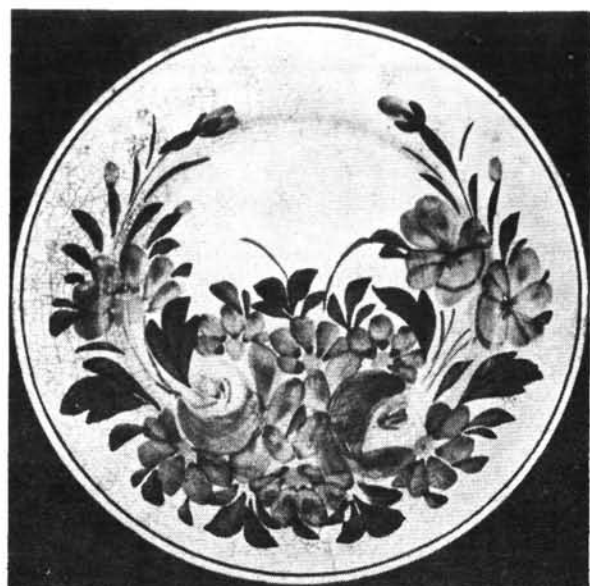
4. ábra. Zsemlyetányér. Abb. 4. Teller für Semmeln.