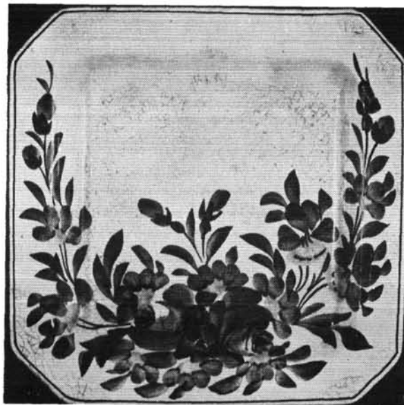
8. ábra. Salátástál. Abb. 8. Salatschüssel.