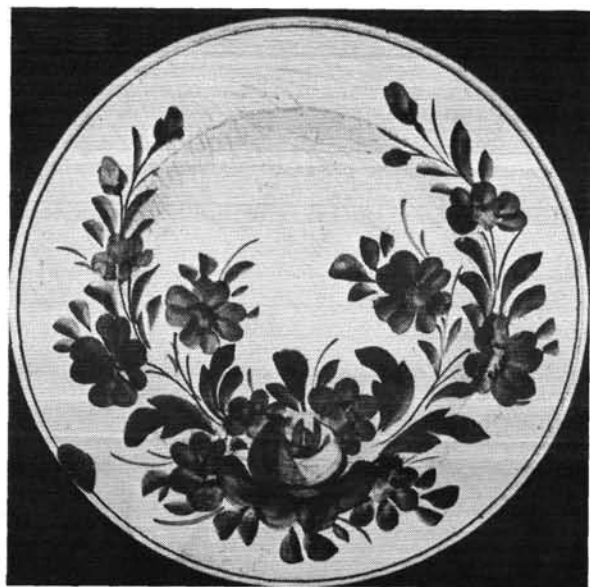
6. ábra. Kerek tésztástál. Abb. 6. Runde Gebackschüssel.