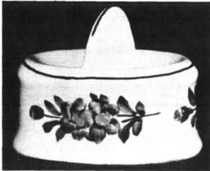
11. ábra. Sótartó. Abb. 11. Salzfass.