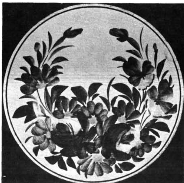
2. ábra. Lapostányér. Abb. 2. Platter Teller.