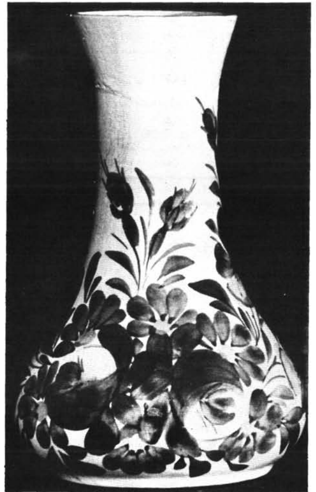
13. ábra. Virágváza. Abb. 13. Blumenvase.