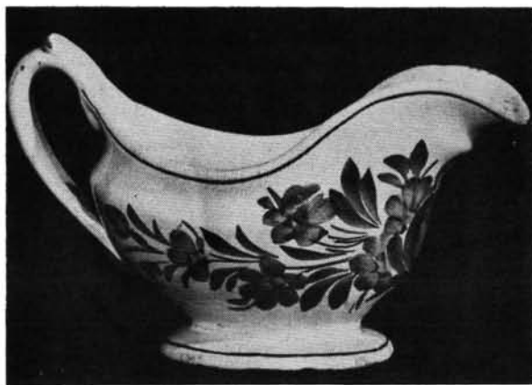
14. ábra. Mártástál. Abb. 14. Sauciere.