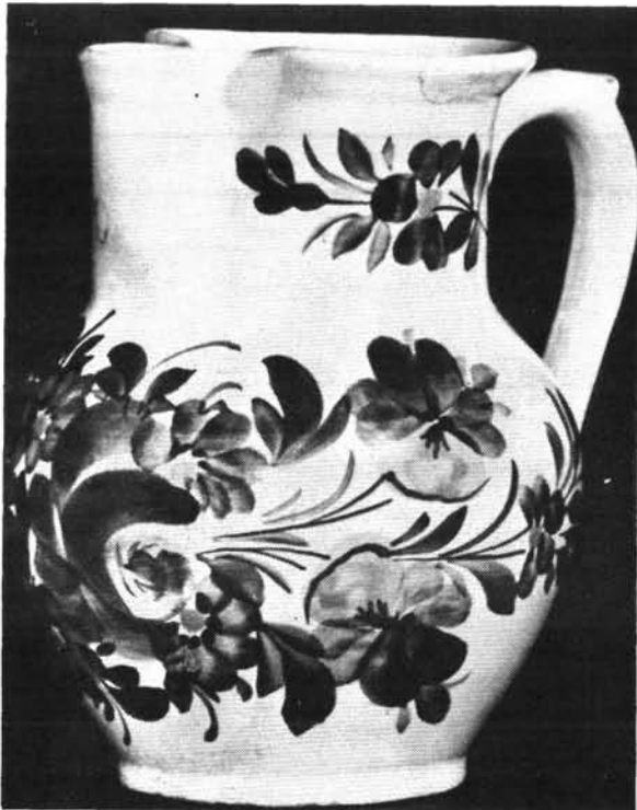
12. ábra. Boroskancsó. Abb. 12. Weinkrug.