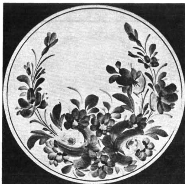
3. ábra. Tésztástányér. Abb. 3. Teller für Geback.