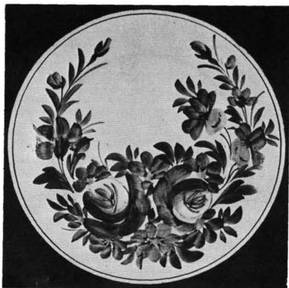
5. ábra. Kerek tésztástál. Abb. 5. Runde Gebackschüssel.