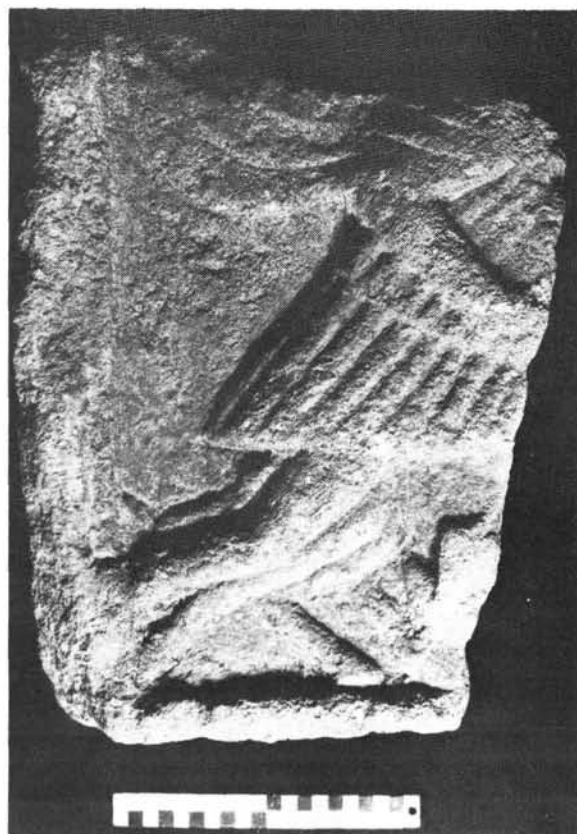
1. ábra. Fényképfelvétel a relieftöredékről

Abb. 1. Eine Fotoaufnahme vom Reliefsfragment