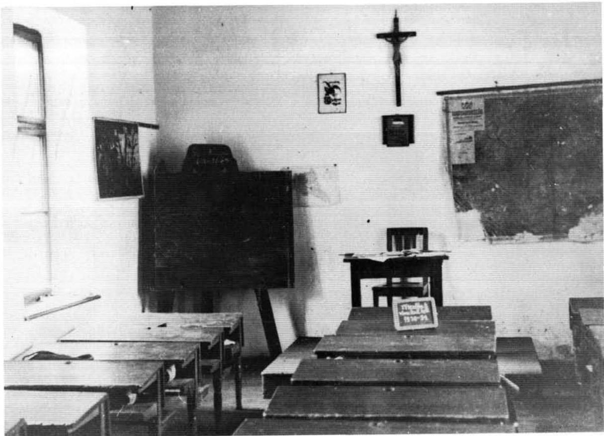
6. ábra. A mezőlaki római katolikus iskola belseje az 1930-as években

A népoktatás területén a 30—40-es évek nem hoztak lényeges változást. Mivel a rendszerben a 20-as évek ellenforradalmi politikája folytatódott szervesen tovább, a neveléspolitikának most is fontos szerep jutott a tömegek összefogásában, a „nemzeti egység” megteremtésében. Az iskolákban a nevelés célja az volt, hogy elmélyítsék a tanulók hazafias és vallásos érzelmeit és megértessék, elfogadtassák velük szüleik és a maguk társadalmi helyzetét. A gazdasági válság a falusi lakosság zömét, a szegény, nincstelen réteget sújtotta leginkább. A nehéz terhek és az alacsony