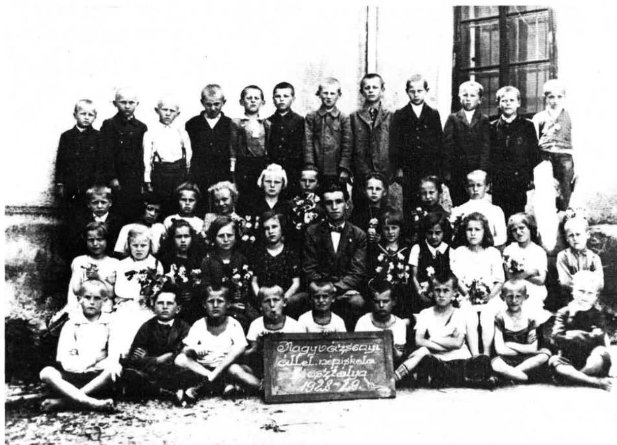
9. ábra. Iskolai csoportkép Nagyvázsönyből az 1928—29-es tanévben