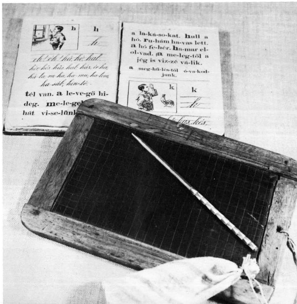
1. ábra. ABC-s könyv és palatábla, palavesszővel