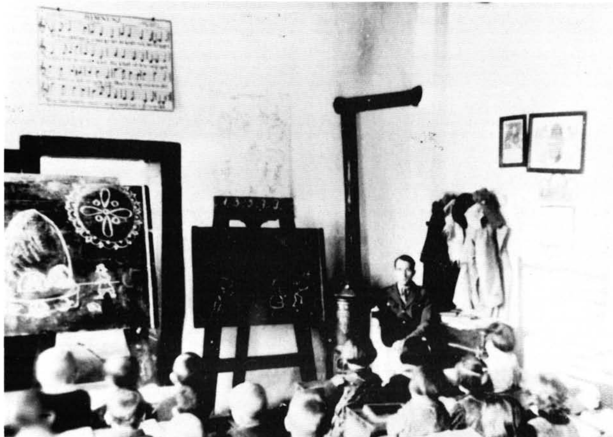
7. ábra. A csöglei református iskola 1. számú tanterme az 1930-as években