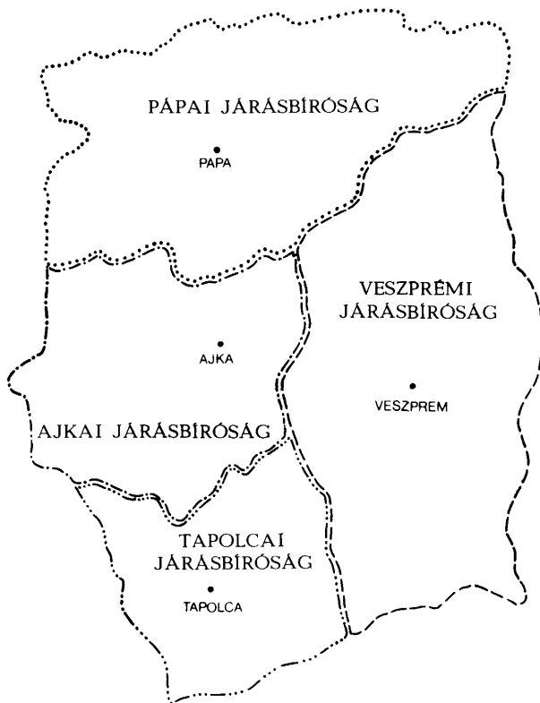
3. sz. térkép: Veszprém megye törvénykezési területi megoszlása 1982-ben