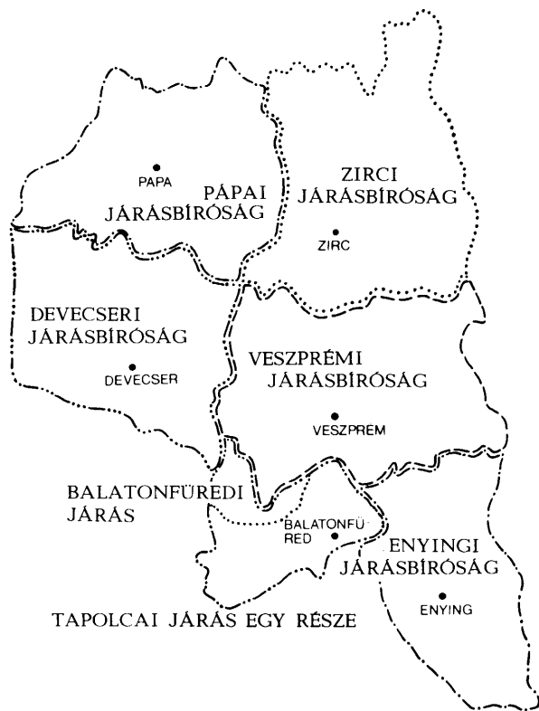
2. sz. térkép: A Veszprém vármegye törvénykezési területi megoszlása a törvénykezés kezdetén, 1871—1872

megye majdnem 2/3-a ide tartozik. A Balaton, a Bakony, s egyéb üdülési területek különösen nyár végén nagyon sok munkát rónak a bíróságra.