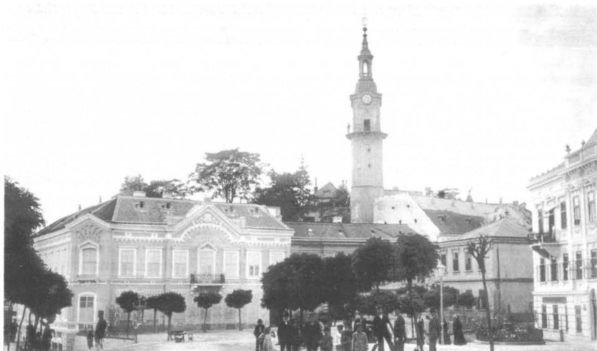
7. ábra. . A Piac tér a Vigyázótoronnyal és a takarékpénztár épületével (LDM M 4265) Figure 7. The Piac tér and the Watchtower, with the savings bank building (LDM M 4265)