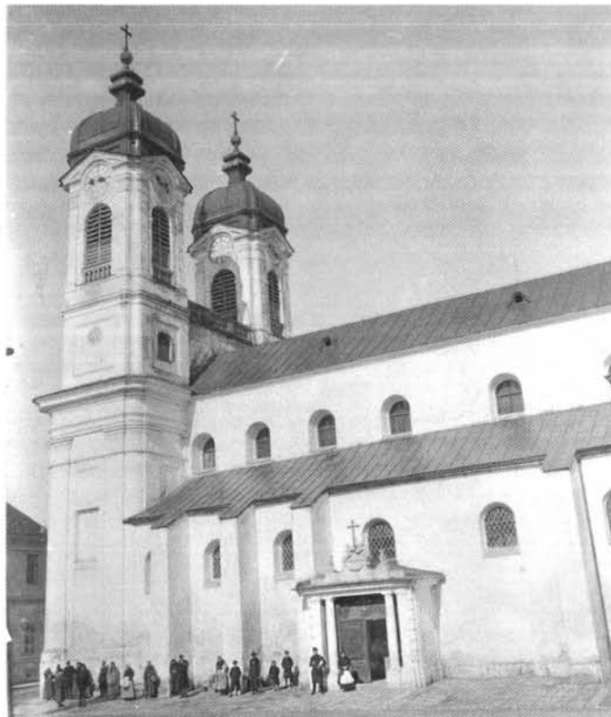
4. ábra. A Szent Mihály Székesegyház az 1907-es átépítés előtt Figure 4. St. Michael's Cathedral before the 1907 reconstruction.