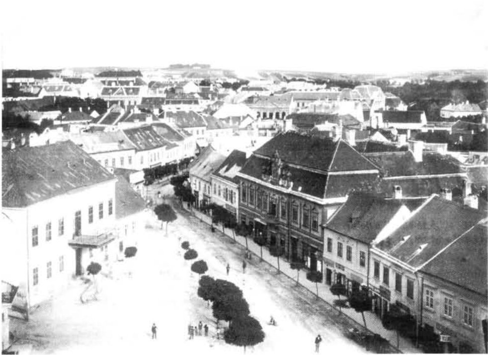
6. ábra. A Piac tér az Úri Kaszinó épületével a Vigyázótornyból szemlélve (LDM M 4204 -3) Figure 6. The Piac tér with the Úri Kaszinó building, seen from the Watchtower (LDM M 4204-3)