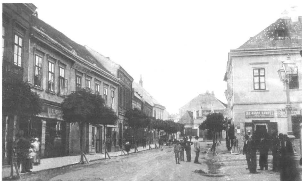
4. ábra. A Fő utca és a Gizella (ma Szabadság) tér, ebben az utcában állt Franciscs Károly háza (LDM M 4204-2) Figure 4. The Fő utca and Gizella tér (now Szabadság tér). Károly Franciscs's house is in this street. (LDM M 4204-2)