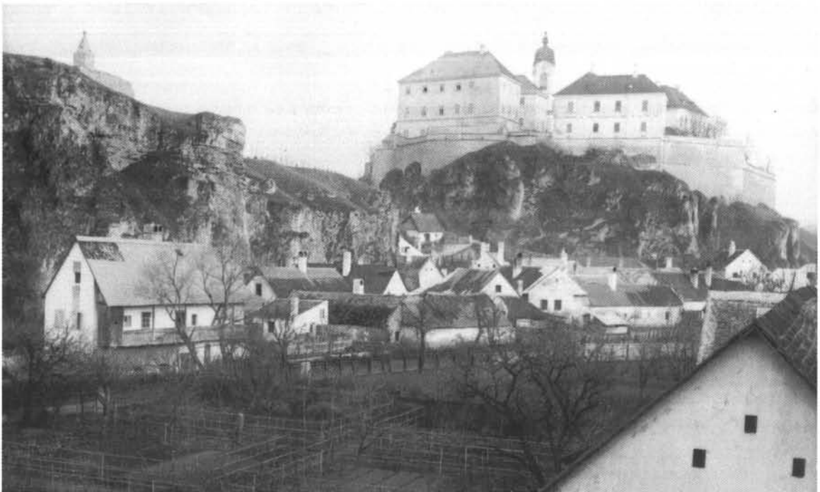
3. ábra. A vár, előtte a Benedek-hegy, 1890 körül (LDM TF 2693) Figure 3. The castle, with Benedek Hill in front, around 1890 (LDM TF 2693)