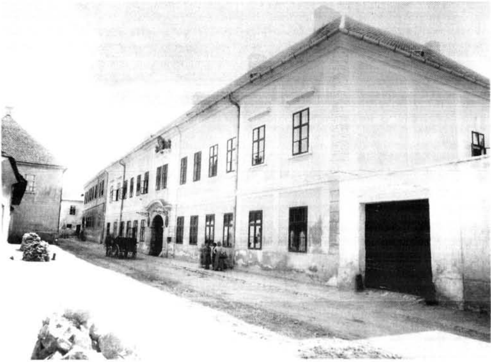
5. ábra. A régi vármegye háza az átépítés előtt, épült a XIX. század első felében (LDM TF 7646) Figure 5. The old county hall, built in the first half of the 19th century, before reconstruction (LDM TF 7646)