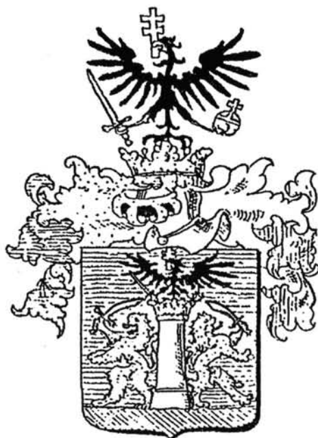
3. ábra. A Pejachevich család nemesi címere (SIEBMACHER 1893 után) Figure 3. The coat-of-arms of the Pejachevich family (SIEBMACHER after 1893)