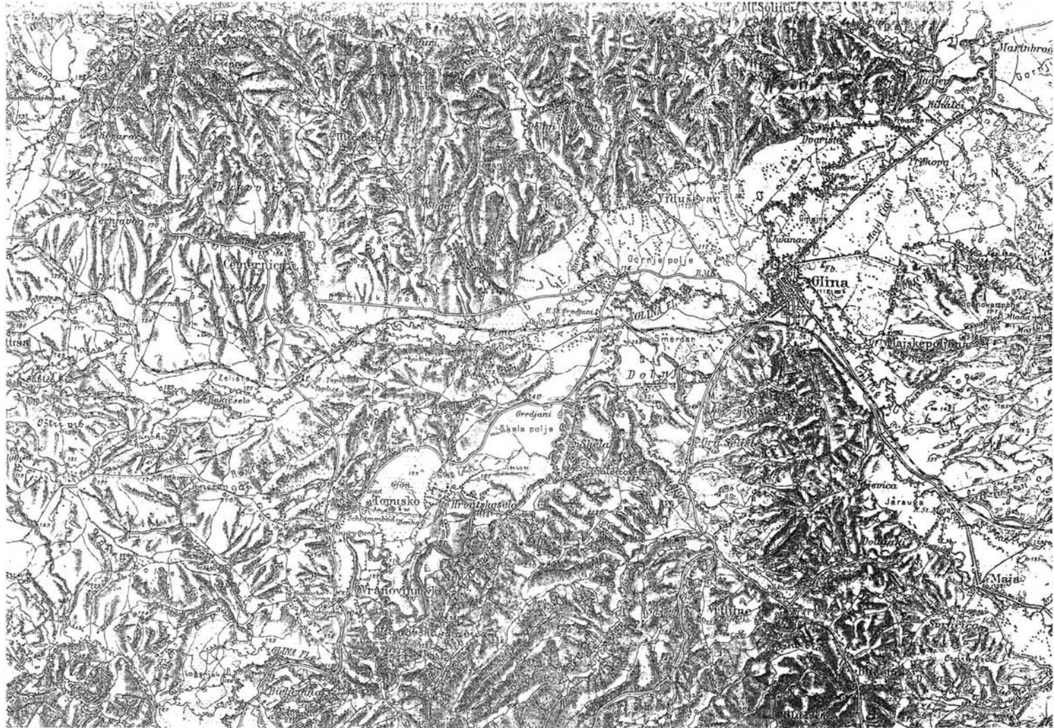
9. ábra. A Glina folyó környéke az 1788-as hadiesemények színhelyeivel, XIX. század vége (Zone 24 Kolonne XIV.)

Figure 9. The region of the Glina river, with the scenes of the 1788 military incidents, at the end of the 19 th century (Zone 24 Kolonne XIV.)