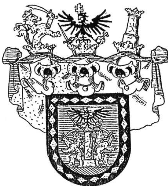
4. ábra. A Pejachevich család grófi címere (SIEBMACHER 1893 után) Figure 4. The count's coat-of-arms of the Pejachevich family (SIEBMACHER after 1893)