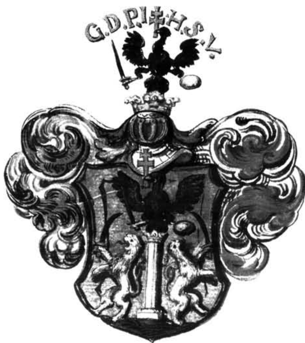
5. ábra. Pejachevich György címere, 1712. Primási Levéltár, Esztergom (BEKE 1995 után)

Figure 5. György Pejachevich's coat-of-arms, 1712. Primatical archives, Esztergom (after BEKE 1995)