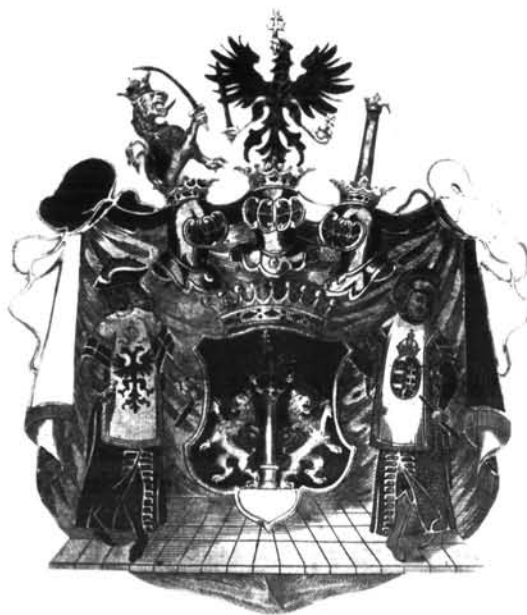
6. ábra. A Pejachevich család grófi címere, XVIII–XIX. sz. Laczkó Dezső Múzeum, Veszprém

Figure 5. György Pejachevich's coat-of-arms, 1712. Primatical archives, Esztergom (after BEKE 1995)