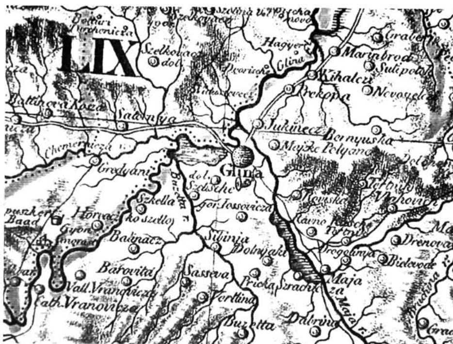
8. ábra. A Glina folyó környéke az 1788-as hadi események színhelyeivel Lipszky János térképén, 1806 (LIPSZKY 1806 után) Figure 8. The region of the Glina river, with the scenes of the 1788 military incidents on János Lipszky's map, 1806 (after LIPSZKY 1806)