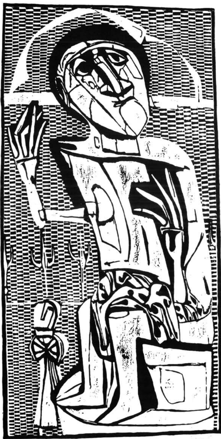
13. ábra. Aprószentek, 1985 Figure 13. Childermas, 1985