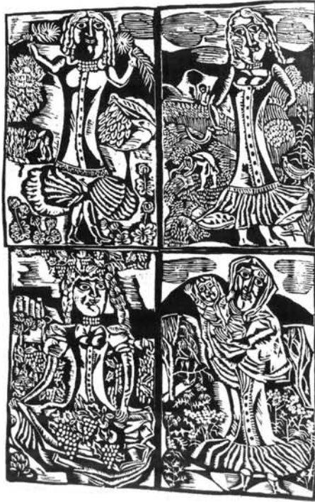
5. ábra. Évszakok I., 1976 Figure 5. Seasons I, 1976