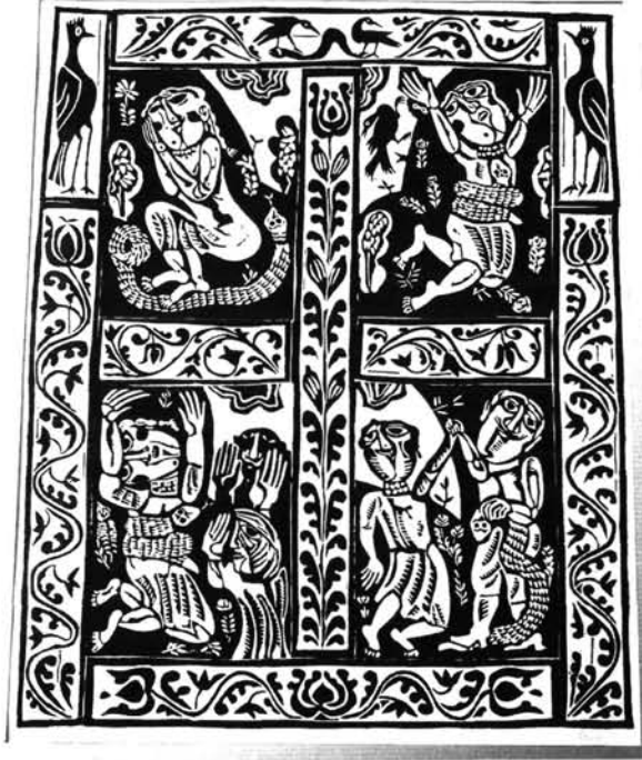
7. ábra. Sári mérges kígyó, 1978 Figure 7. Sally poisonous snake, 1978