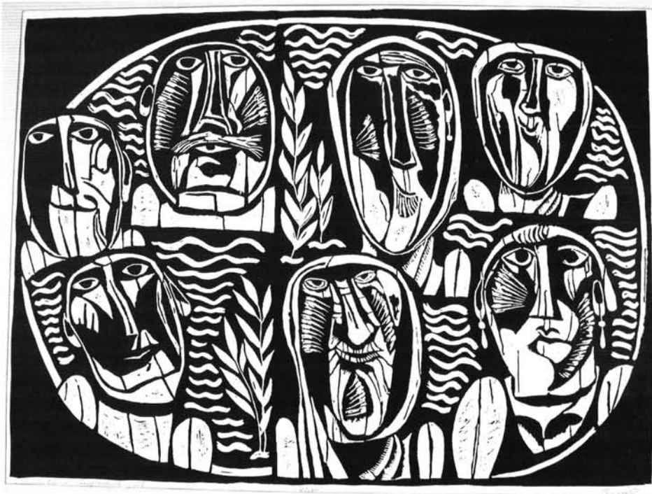
11. ábra. Gyógyfürdőben, 1981 Figure 11. In the spa, 1981