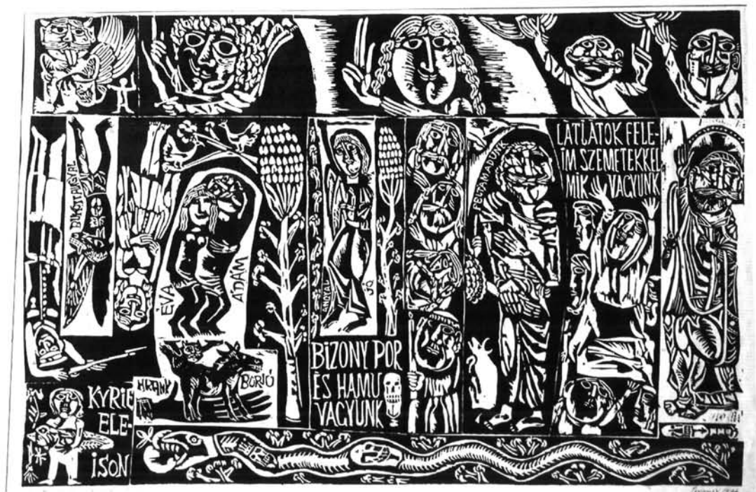
9. ábra. Halotti beszéd, Figure 9. Funeral oration, 1976