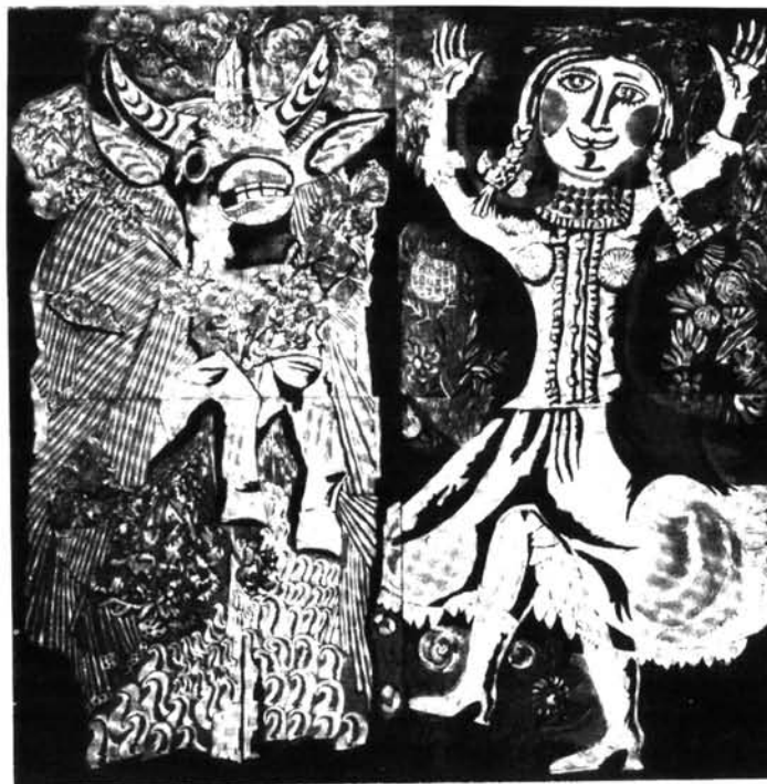
2. ábra. Tavaszünnep, 1973 Figure 2. Spring festival, 1973