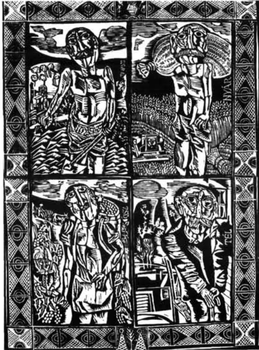
6. ábra. Évszakok II., 1976 Figure 6. Seasons II, 1976