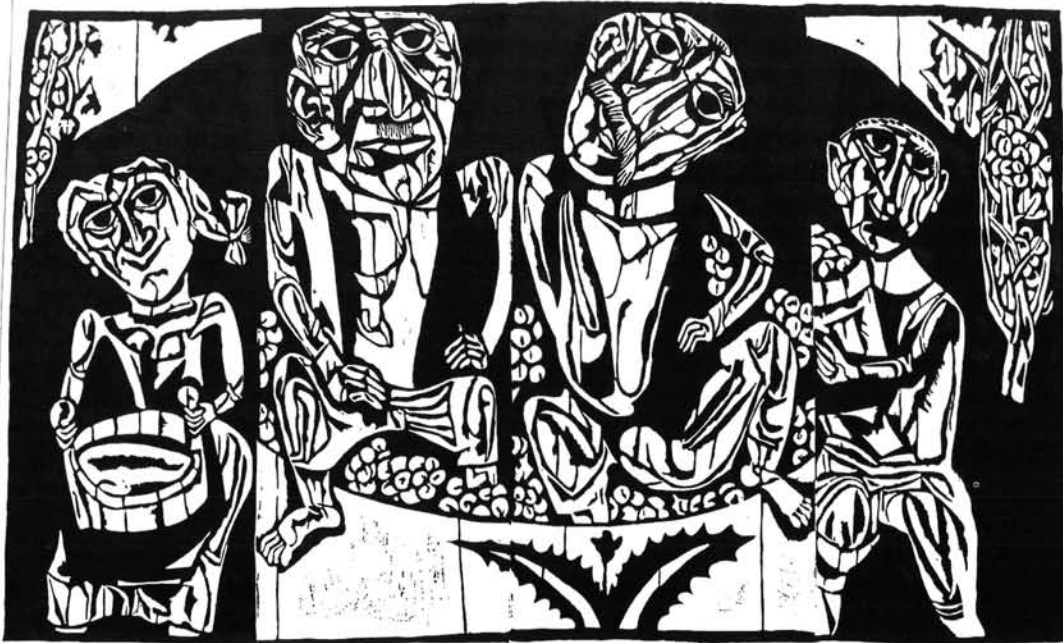
12. ábra. Szőlőtíprók, 1979 Figure 12. Grape treaders, 1979