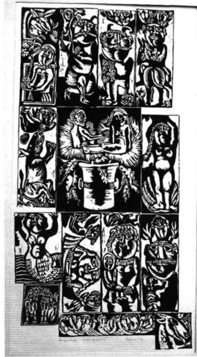
8. ábra. Rongyszőnyeg, 1976 Figure 8. Rag carpet, 1976