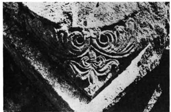
6. kép: Oszloplábazat palmettás díszítése Zselicszent- jakabról. Palmettenverzierte Säulenbase von Zselicszentjakab.