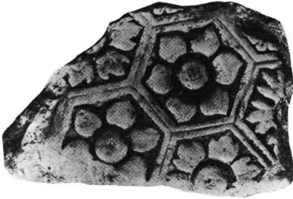
1. kép: Rozettás és hatszöges márványtöredék Zalavárról. Marmorfragment mit Rosetten im Sechsecknetz von Zalavár.