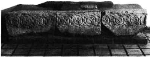
3. kép: Márványgerenda szalagfonatos díszítése Zalavárról. Marmorbalken mit Flechtwerk von Zalavár.