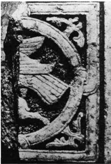
5. kép: Mellvédlap töredéke, állatküzdelem (nyúlra lecsapó sas?) ábrázolásával Zalavárról. Fragment einer Schrankenplatte mit Tierkampfszene (auf ei- nen Hasen herabschießender Adler?) von Zalavár.