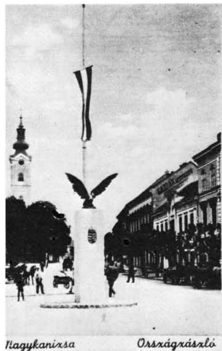
26. kép: Az Országzászló a turulmadárral az 1930-as években. Die Landesfahne mit dem Turulvogel aus den 30er Jahren des 20. Jahrhunderts.