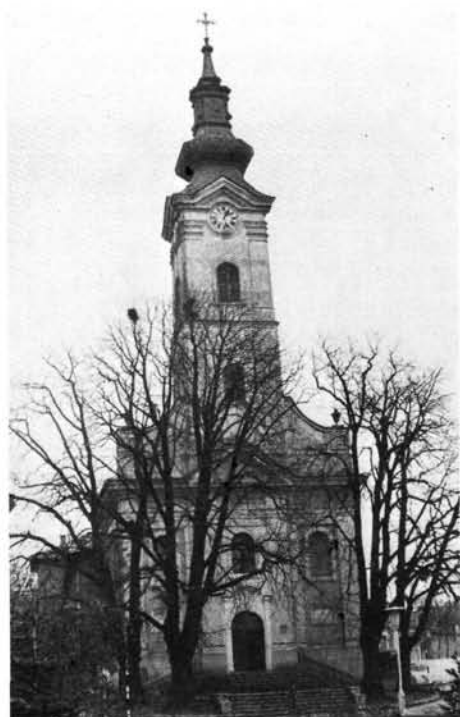
27. kép: Az átépített Felsőtemplom a megma- radt 19. századi toronnyal. Die umgebaute Obere Kirche (Felsőtemplom) mit dem erhalten gebliebenen Turm aus dem 19. Jahrhundert.