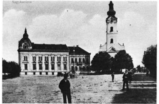
20. kép: Az Oszták—Magyar Bank palotája a König-házzal az 1910-es években.

Die Hauptstraße (Fő út) zur Jahrhundertwende. Im Hintergrund die Obere Kirche (Felsőtemplom) und das König-Haus, woneben noch das ebenerdige Weiss-Haus steht.