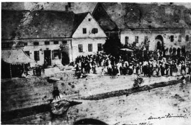
11. kép: Úrnap körmenet 1864-ben. A háttérben a Deák tér 11–12. számú egykori földszintes ház, tőle jobbra a Pollák- ház elődje, az ún. Theodorovich-ház.

Fronleichnamprozession 1864. Im Hintergrund Deák-Platz 11–12, ehemaliges ebenerdiges Haus, davon rechts der Vor- gängerbau des Pollák-Hauses, das sog. Theodorovich-Haus.