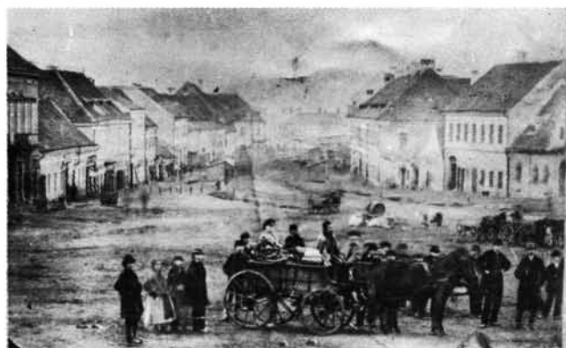
13. kép: A Fő tér az 1860-as években. (Bal oldalon az első épület a Wlassics-ház, mellette Németh szücsmester földszintes, majd gr. Széchenyi emeletes háza. A jobb oldalon félig látszik a Lovák-ház, mellette az emeletes Babócsay-ház áll.) Der Hauptplatz (Fő tér) in den 60er Jahren des 19. Jahrhunderts.