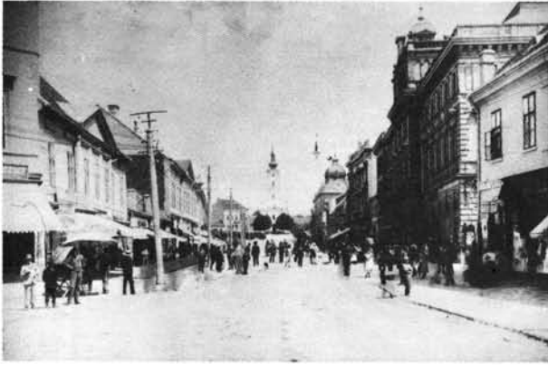
19. kép: A Fő út a századfordulón. Háttérben a Felsőtemplom és a König-ház, amely mellett még a földszintes Weiss-ház áll.

Die Hauptstraße (Fő út) zur Jahrhundertwende. Im Hintergrund die Obere Kirche (Felsőtemplom) und das König-Haus, woneben noch das ebenerdige Weiss-Haus steht.