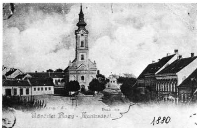
1. kép: A Felsőtemplom 1880-ban. Előtérben a Törökkút, klasszicista oszlopán az anyukával. Die Obere Kirche (Felsőtemplom) 1880. Im Vorraum Türkenbrunnen, mit Engel auf seiner klassizistischen Säule.