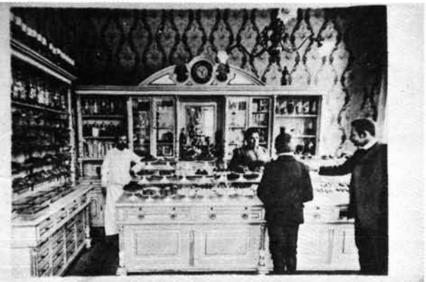
23. kép: A Bajer cukrászda üzlethelyisége. Der Innenraum der Konditorei Bajer.