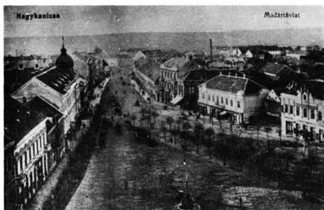
17. kép: A Deák tér madártávtólból a század elején. (A Török-kút klasszicista oszlopán az angyalka helyett ívlámpa áll.) Der Deák-Platz aus der Vogelperspektive Anfang des Jahrhunderts (auf der klassizistischen Säule des Türkenbrunners steht anstelle des Engels eine Bogenlampe).