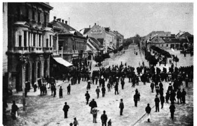
12. kép: Katonai felvonulás a múlt század végén. Militärparade Ende des vergangenen Jahrhunderts.

Fronleichnamprozession 1864. Im Hintergrund Deák-Platz 11–12, ehemaliges ebenerdiges Haus, davon rechts der Vor- gängerbau des Pollák-Hauses, das sog. Theodorovich-Haus.