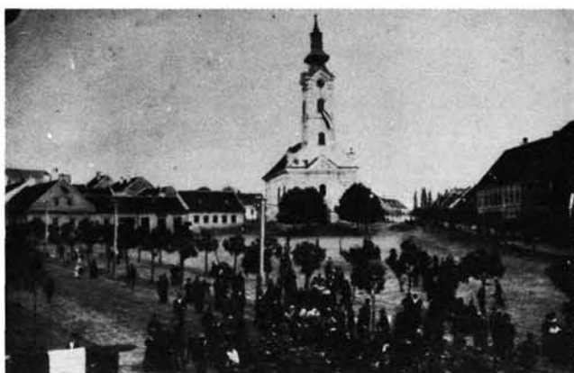
18. kép: A Felsőtemplom melletti Weiss- és Wuztli-házak az 1890-es években. Die Weiss- und Wuztli-Häuser neben der Oberen Kirche (Felsőtemplom) in den 90er Jahren des 19. Jahrhunderts.