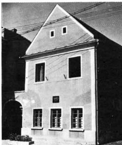
5. kép: A Kölcsey utca sarkán álló egykori Egylet-ház, a későbbi Ipartestületi Székház. Ehemaliges Vereinshaus an der Ecke der Kölcsey-Straße, später Vereinshaus des Gewerbeverbandes.