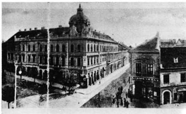
14. kép: A Nagykanizsai Takarékpénztár székháza a megnyitott új utcával. Sitz der Sparkasse von Nagykanizsa mit der neueröffneten Straße.