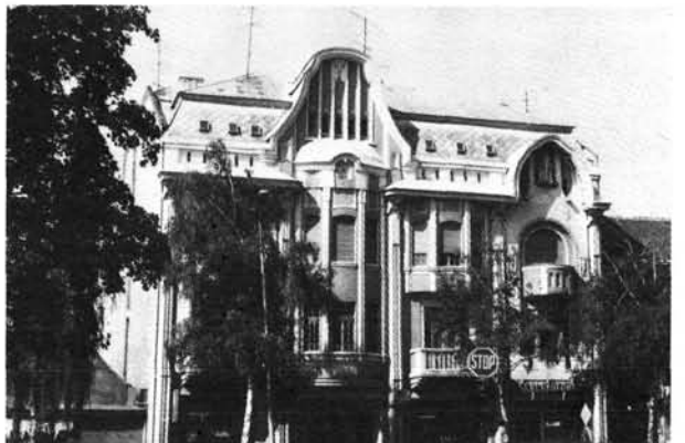
24. kép: A Bogenrieder-palota. Der Bogenrieder-Palast.