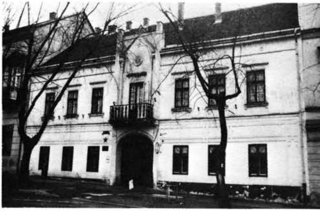
7. kép: A romantikus stílusú Deák tér 2. számú Grünhut-ház. Deák-Platz 2, das Grünhut-Haus im romantischen Stil.