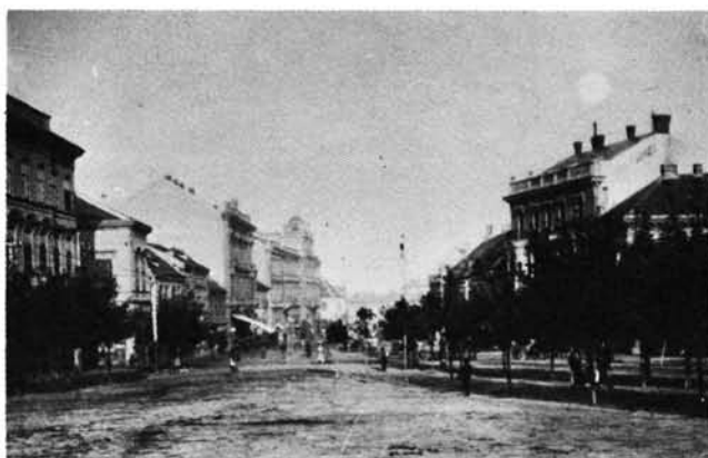
16. kép: Az átadott villanyvilágítás a Deák téren a múlt század végén. Die neue elektrische Beleuchtung auf dem Deák-Platz Ende des vergangenen Jahrhunderts.