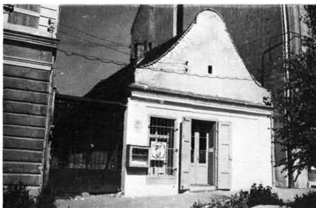
3. kép: A Deák tér 9. számú, ma is álló barokk oromfalas épület. Deák-Platz 9, heute noch stehendes, barockes Giebelgebäude.