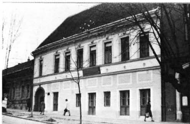
2. kép: A Deák tér 5. sz. alatti Axenti-ház. Deák-Platz 5, Axenti-Haus.