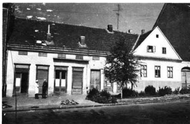
4. kép: Az északi oldal hajdani földszintes házai (Deák tér 11–12.). Die ehemaligen ebenerdigen Häuser der Nordseite (Deák-Platz 11–12).