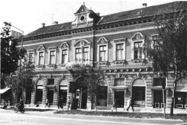
21. kép: A Deák tér 10. számú Pollák-ház. Deák-Platz 10, Pollák-Haus.

Der Palast der Österreichisch—Ungarischen Bank mit dem König-Haus im zweiten Jahrzehnt des 20. Jahrhunderts.