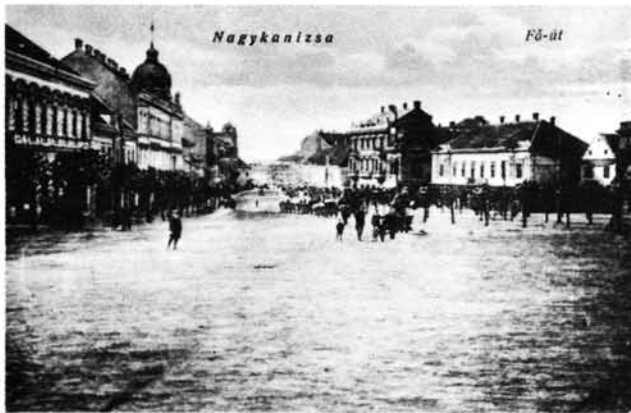
9. kép: Század eleji felvétel a térről, bal oldalon a Hild-ház. Aufnahme über den Platz vom Anfang des Jahrhunderts, links das Hild-Haus.