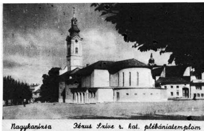
28. kép: A Felsőtemplom új kereszthajós része. Das neue Kreuzschiff der Oberen Kirche (Felsőtemplom).