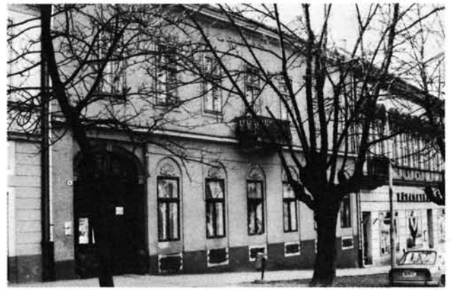
8. kép: A Deák tér 4. számú Plébániaház („Grünhut-ház”). Deák-Platz 4, Pfarrhaus („Grünhut-Haus”).