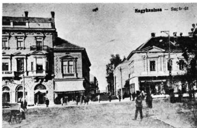
15. kép: Az 1883-ban megnyitott Sugár út, jobb oldalon a Lovák-házzal. Die 1883 eröffnete Sugár-Straße, rechts mit dem Lovák-Haus.