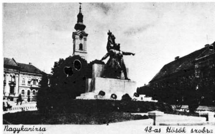
25. kép: A 48-as gyalogezred emlékműve. Denkmal des Infanterieregiments von 1848.