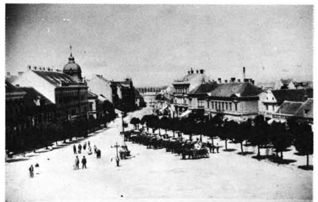
10. kép: A „Suszteralle” a század elején a vásárra érkező kerekkel. Die „Suszteralle” Anfang des Jahrhunderts mit auf dem Markt eintreffenden Fuhrwerken.