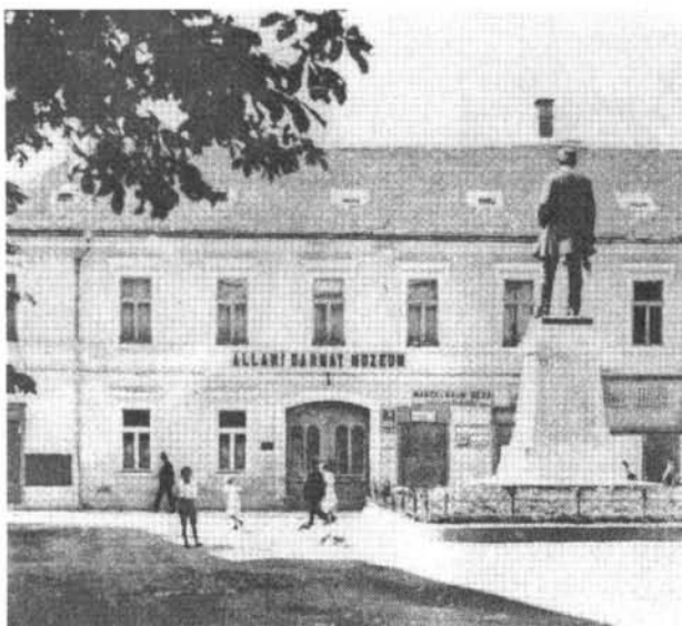
4. kép: Az Állami Darnay Múzeum új épülete Sümegen