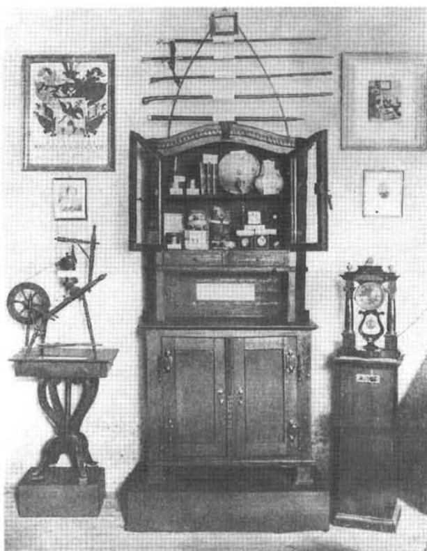
3. kép: Kisfaludy Sándor és Szegedy Róza emléktárgyai