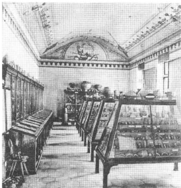
1. kép: A Darnay-gyűjtemény, a szülőház melletti nagyteremben