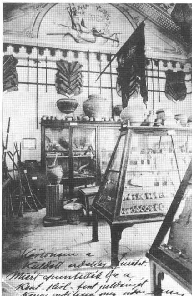
2. kép: A Darnay-gyűjtemény, a szülőház melletti nagyteremben