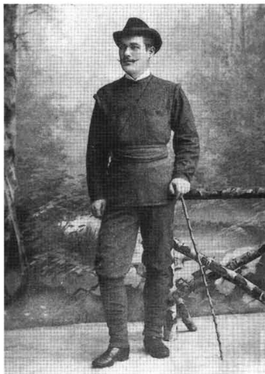
2.kép: A távgyalogló, 1886 (Dunky fivérek, Kolozsvár)