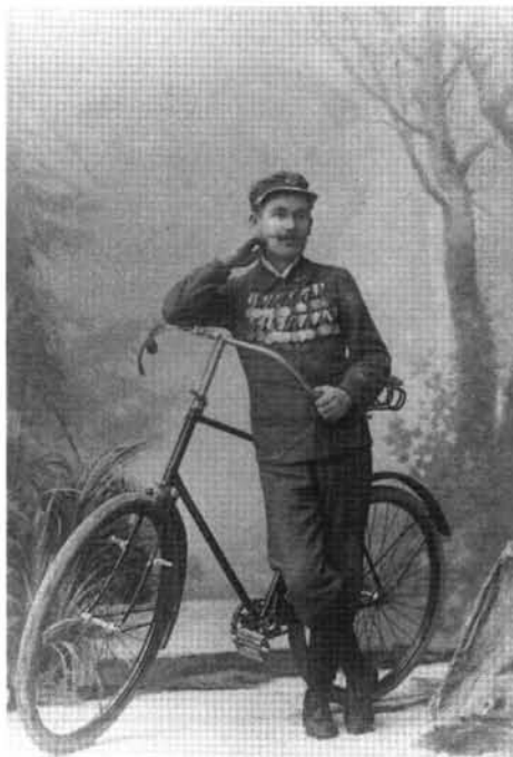
3.kép: A "széllel bélelt törpe" un. biztonsági biciklivel, 1890 körül (Dunky fivérek, Kolozsvár)