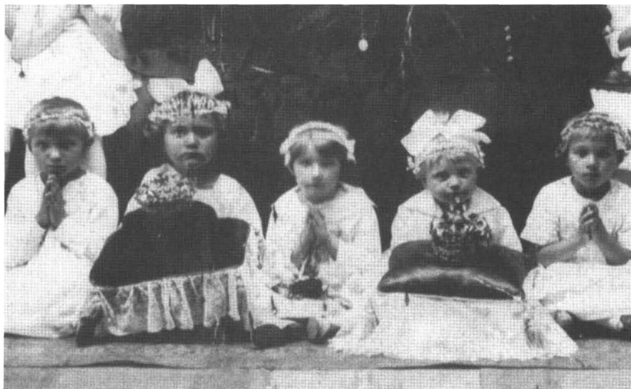
3. kép: Mária koronák. Zenta 1924.