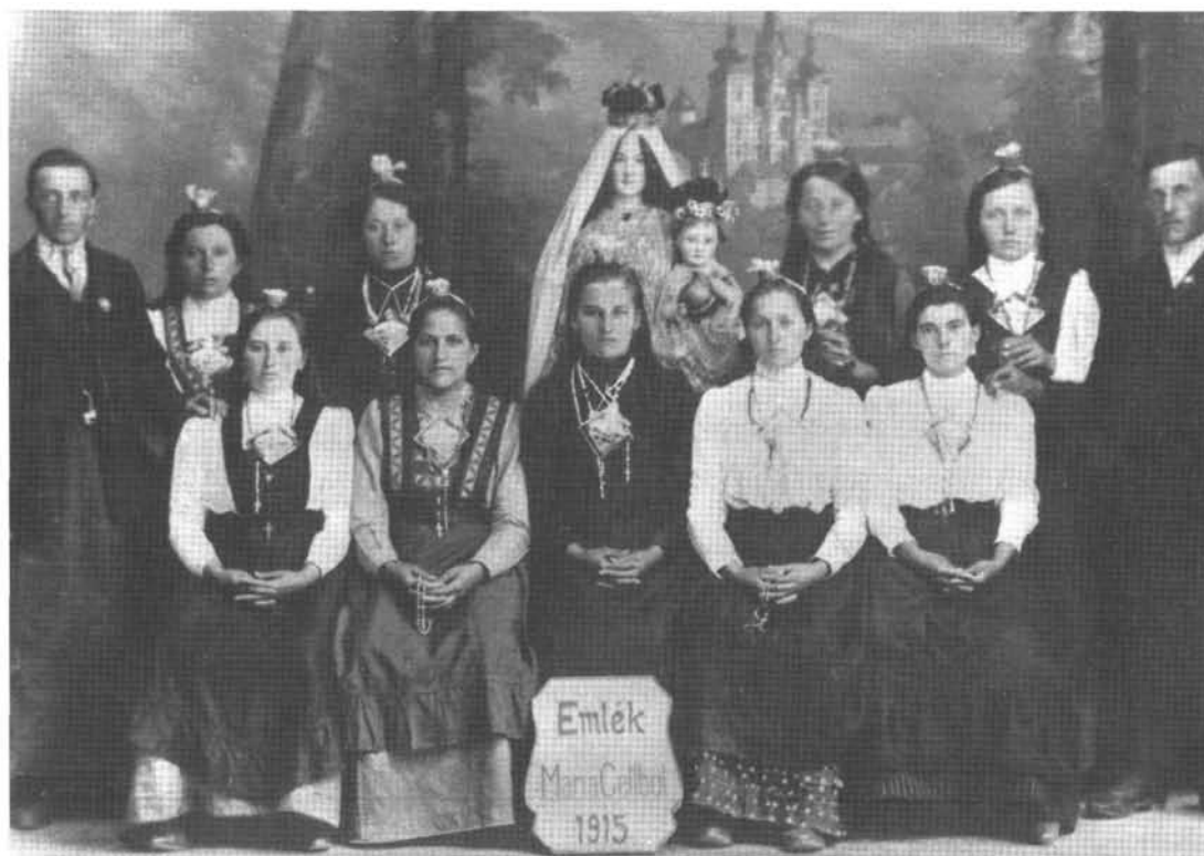
4. kép: Máriacelli búcsús lányok 1915-ből.