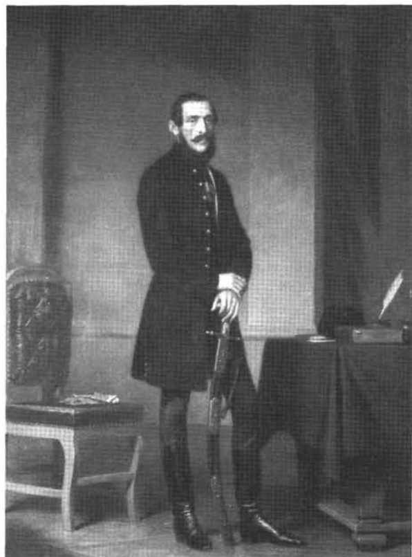
9. kép: Katalógus 9.