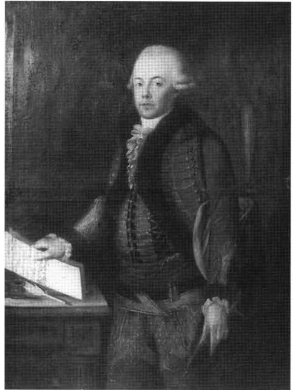
6. kép: Katalógus 6.