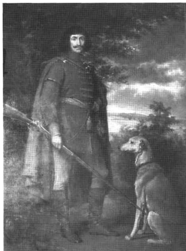
11. kép: Katalógus 11.