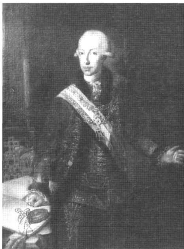
4. kép: Katalógus 4.