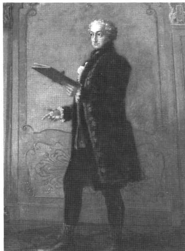
12. kép: Katalógus 12.