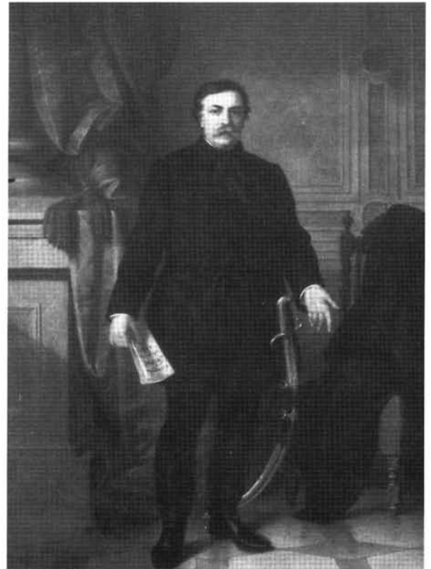
8. kép: Katalógus 8.