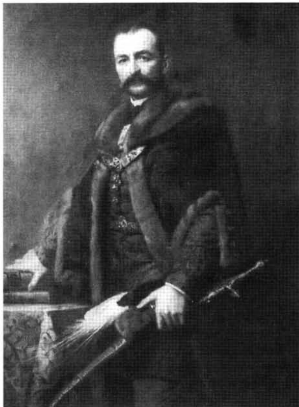
19. kép: Katalógus 19.