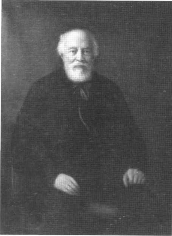
13. kép: Katalógus 13.