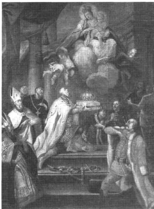
1. kép: Katalógus 1.