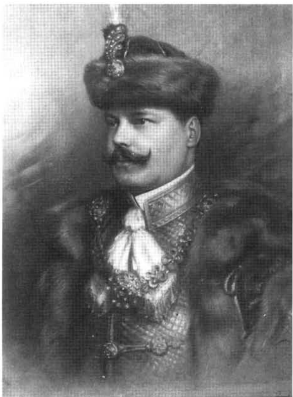
23. kép: Katalógus 23.