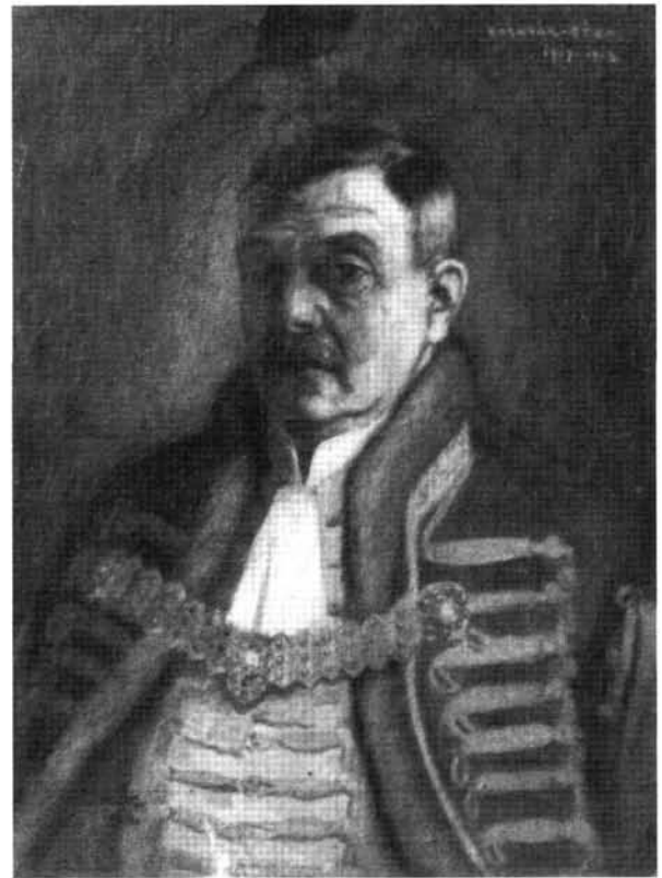
20. kép: Katalógus 20.