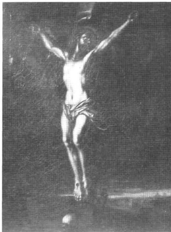
2. kép: Katalógus 2.