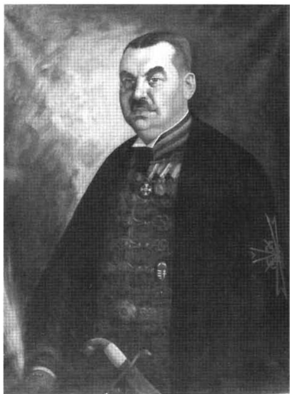
24. kép: Katalógus 24.