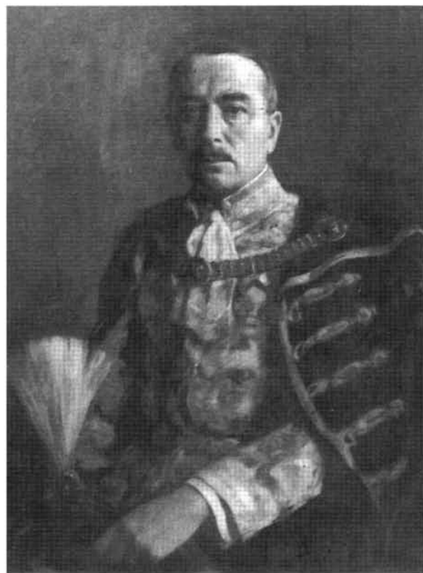
22. kép: Katalógus 22.