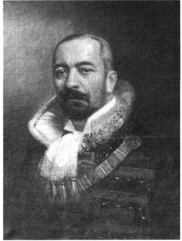
18. kép: Katalógus 18.