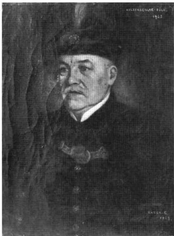
21. kép: Katalógus 21.