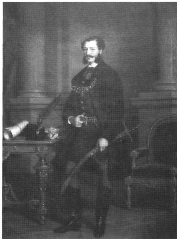
10. kép: Katalógus 10.