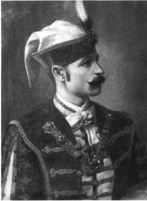
17. kép: Katalógus 17.