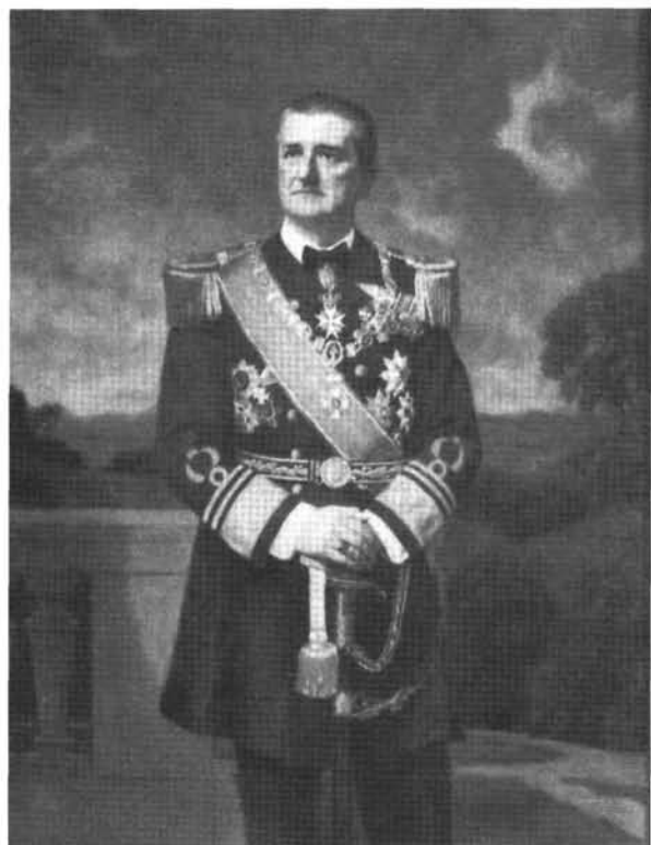
25. kép: Katalógus 25.