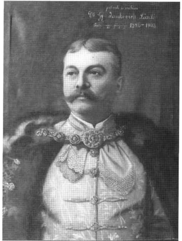
14. kép: Katalógus 14.