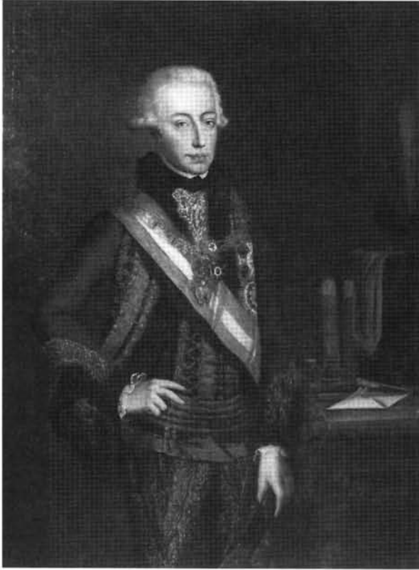
5. kép: Katalógus 5.