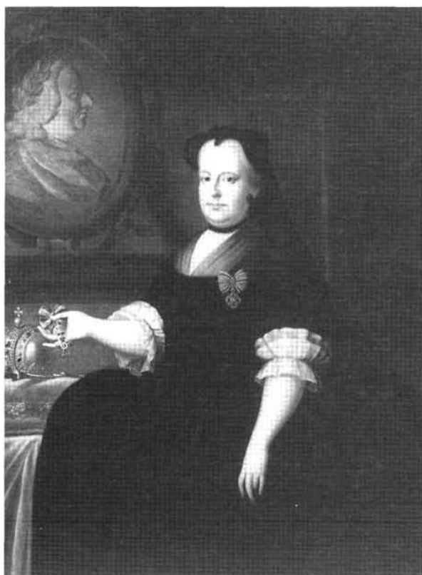
3. kép: Katalógus 3.