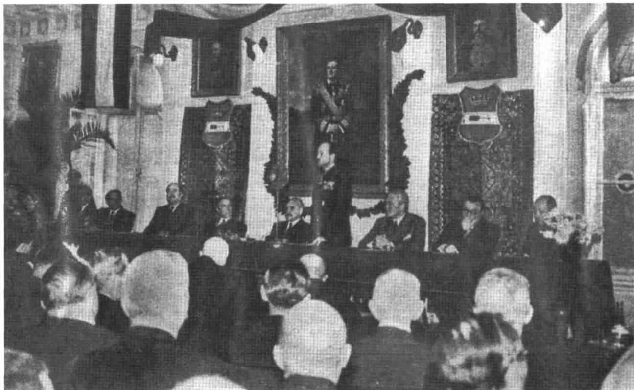
27. kép: A zalaegerszegi Megyeháza díszterme Kállay Miklós miniszterelnök 1942. évi látogatása alkalmával