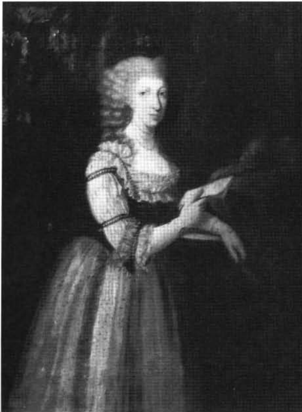
7. kép: Katalógus 7.